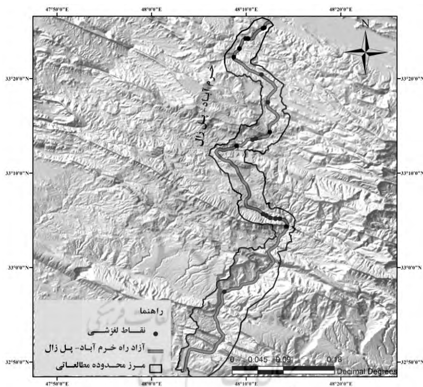
شکل ۲. موقعیت پهنه‌های لغزشی فعال در مسیر آزادراه خرم‌آباد- پل زال

تصمیم‌گیری و ارائه راهکار در این مورد نمود؛ زیرا خطای کاربر، داده‌ها و مدل‌های مورد استفاده به علاوه اعمال نظر و سلیقه در وزن دهی به فاکتورها باعث می‌شود که نقشه نهایی تولید شده با آنچه در واقعیت وجود دارد، هم‌خوانی لازم را نداشته باشد. به همین دلیل اولین اقدام در بررسی جاده‌های ارتباطی از دیدگاه پدافند غیرعامل، شناسایی مناطقی است که به عنوان خطر تلقی شده و تهدید کننده مسیر جاده می‌باشند. بررسی مسیر جاده و محیط اطراف آن حاکی از رخداد حرکات توده‌ای زمین لغزش و ریزش در مسیر مورد مطالعه است. بر اساس مطالعات میدانی، ۲۱ پهنه لغزشی بزرگ که فعال بوده و تهدید کننده مسیر جاده می‌باشند، شناسایی شده است که موقعیت و ویژگی‌های آنها در شکل ۲ و جدول ۱ آورده شده است.