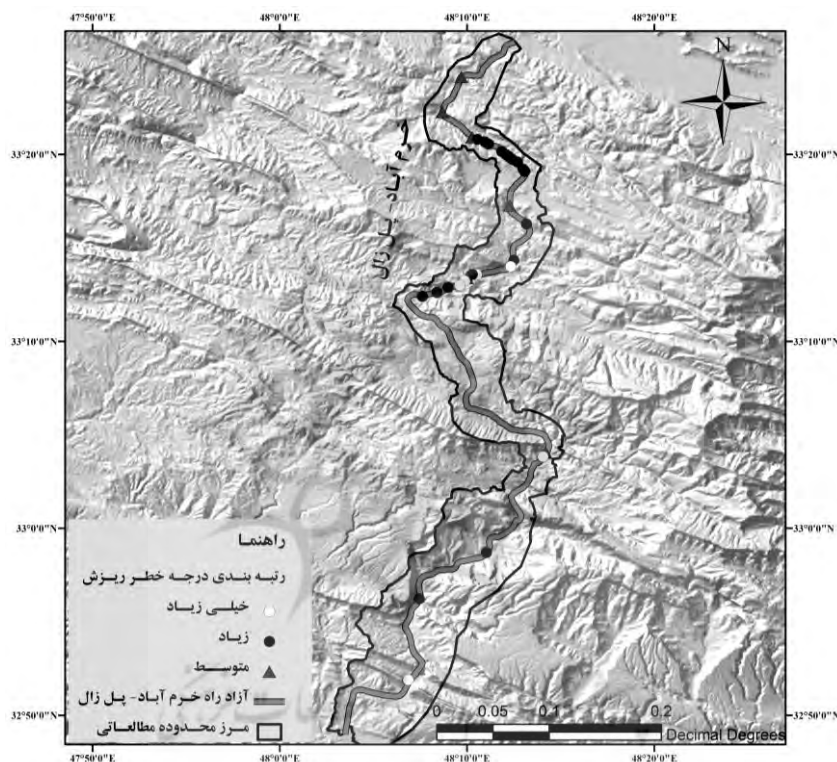
شکل ۱۱. رتبه‌بندی درجه خطر ریزش‌های شناسایی شده در مسیر آزادراه خرم‌آباد- پل زال

بر اساس جدول ۴، از ۳۰ نقطه ریزشی شناسایی شده ناپایدار و مخاطره‌آمیز مسیر جاده، ۶ نقطه دارای خطر خیلی زیاد، ۱۸ نقطه دارای خطر زیاد و ۶ نقطه دارای خطر متوسط می‌باشند. همان طور که در شکل ۱۱ نشان داده شده است از ۶ نقطه ریزشی با خطر خیلی زیاد، ۴ نقطه در بخش اول مسیر از کیلومتر ۳۰ تا کیلومتر ۳۶ و ۲ ریزش دیگر در بخش دوم مسیر و در کیلومتر ۶۳ و ۹۳ قرار دارند. ریزش‌های با خطر زیاد در بخش اول مسیر از کیلومتر ۱۳ تا ۱۹/۵ و در بخش دوم مسیر از کیلومتر ۲۵ تا ۳۹ و ریزش‌های با خطر متوسط به صورت پراکنده به‌ویژه در ابتدای مسیر آزادراه واقع شده‌اند.