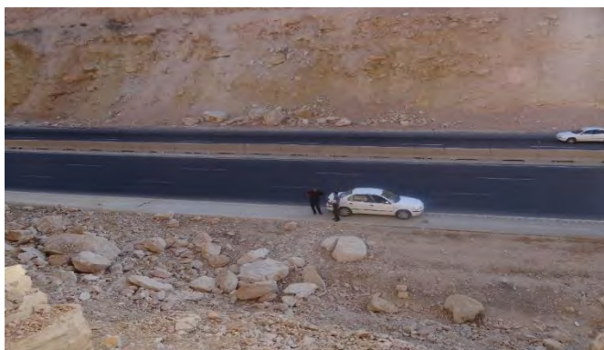
شکل ۸. ریزش توده‌های سنگی در کیلومتر ۱۳ مسیر آزادراه خرم آباد- پل زال در دو سمت جاده

برخی از ریزش‌ها توسط دیوارهای حائل و یا بلوک‌های سیمانی کنترل شده‌اند؛ اما با وجود سطوح ریزشی فعال و پر شدن پشت دیواره‌های حائل در طول مسیر به نظر می‌رسد این راهکارها در کوتاه مدت می‌توانند کنترل کننده سنگ‌های ریزشی باشند (۹). هم‌چنین برخی از دیواره‌های حائل توسط سنگ‌های ریزشی بزرگ در طول مسیر تخریب شده‌اند (شکل ۱۰).