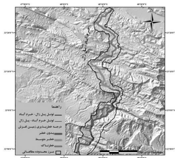
شکل ۶. درجه خطرپذیری مسیر آزادراه خرم آباد- پل زال از نظر خطر زمین لغزش‌های تهدید کننده مسیر جاده