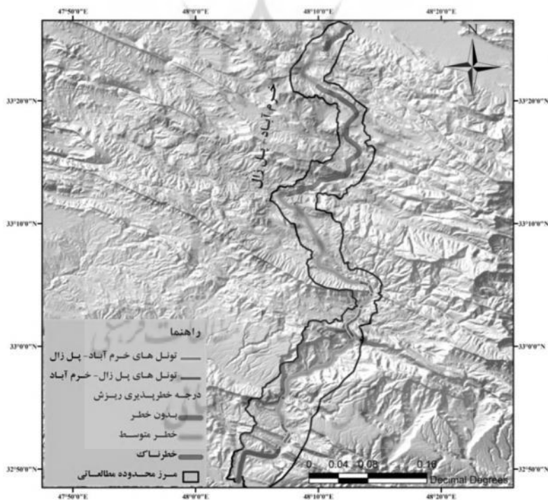
شکل ۱۴. درجه خطرپذیری مسیر آزادراه خرم‌آباد- پل زال از نظر خطر ریزش‌های تهدید کننده مسیر جاده

بر اساس نقشه خطر ریزش، مسیر آزادراه به ۷ بخش و در سه طبقه بدون خطر، خطر متوسط و خطرناک تقسیم شده است. بخش بدون خطر ۱۷/۲ کیلومتر، بخش با خطر متوسط ۶۳/۱ کیلومتر و بخش خطرناک ۲۳/۷ کیلومتر را شامل می شود. بخش خطرناک از کیلومتر ۱۳ تا ۱۹/۵ و ۲۲ تا ۳۹/۲، بخش بدون خطر از ابتدای مسیر تا کیلومتر ۶، کیلومتر ۱۹/۸ تا ۲۳ و ۹۶ تا ۱۰۴ را در بر گرفته است. سایر قسمت‌ها که بیشتر مسیر آزادراه را شامل می شود، در طبقه با خطر متوسط قرار دارند. لازم به ذکر است که در تهیه نقشه خطر ریزش، فقط ریزش‌های تهدید کننده جاده در نظر گرفته شده‌اند. وگرنه ممکن است در طبقه بدون خطر نیز ریزش‌هایی وجود داشته باشد، اما چون یا حجم آن‌ها بسیار کوچک بوده و یا در فاصله دور از جاده قرار دارند، بنابراین در محدوده بدون خطر قرار گرفته‌اند. هم چنین موقعیت تونل‌های هم پوشانی شده بر روی نقشه خطر ریزش بیانگر این است که فقط دهانه ورودی و خروجی تونل‌ها با توجه به اینکه در کدام طبقه خطر واقع شده‌اند، در بحث خطر ریزش مد نظر قرار می‌گیرد. لازم به ذکر است که تونل‌ها عمدتاً در طبقه با خطر متوسط و بدون خطر قرار دارند.