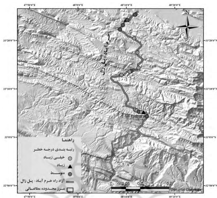
شکل ۵. رتبه‌بندی درجه خطر زمین‌لغزش‌های شناسایی شده در مسیر آزادراه خرم‌آباد- پل زال

گیرد. لازم به ذکر است که فاصله از جاده و حجم توده لغزشی به عنوان مهم‌ترین فاکتورها در اولویت‌بندی خطر زمین‌لغزش‌ها در نظر گرفته شده‌اند.