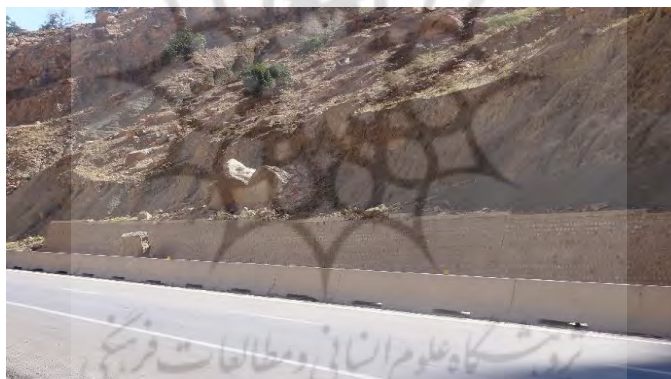
شکل ۹. پر شدن پشت دیواره‌های حائل و بلوک‌های سیمانی توسط سنگ‌های ریزشی در کیلومتر ۸۴ آزادراه

برخی از ریزش‌ها توسط دیوارهای حائل و یا بلوک‌های سیمانی کنترل شده‌اند؛ اما با وجود سطوح ریزشی فعال و پر شدن پشت دیواره‌های حائل در طول مسیر به نظر می‌رسد این راهکارها در کوتاه مدت می‌توانند کنترل کننده سنگ‌های ریزشی باشند (۹). هم‌چنین برخی از دیواره‌های حائل توسط سنگ‌های ریزشی بزرگ در طول مسیر تخریب شده‌اند (شکل ۱۰).