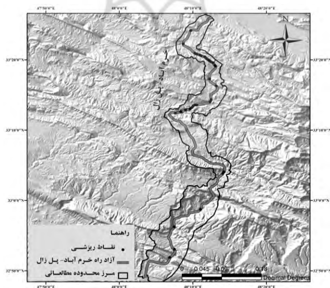
شکل ۷. سطوح ریزشی شناسایی شده و مخاطره‌آمیز مسیر آزادراه خرم آباد- پل زال

در محدوده مورد بررسی که واحدهای زمین‌شناسی آن شامل آهک به صورت ضخیم لایه و توده‌ای با پرتگاه‌های بلند، شیل، مارن، کنگلومرا و آبرفت‌های کواترنر است، ریزش‌های گسترده به فراوانی دیده می‌شوند. در مطالعات میدانی، موقعیت جغرافیایی و ویژگی‌های ۳۰ سطح ریزشی فعال برداشت شد که موقعیت آن‌ها در شکل ۷ و ویژگی‌های آن‌ها در جدول ۳ آورده شده است.