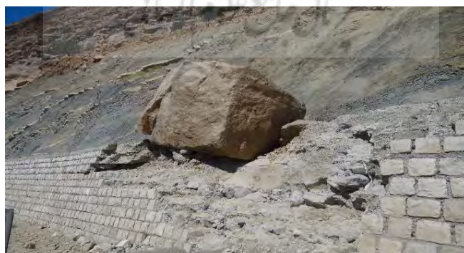
شکل ۱۰. تخریب دیواره‌های حائل اطراف جاده توسط تخته سنگ‌های ریزشی در کیلومتر ۸۴