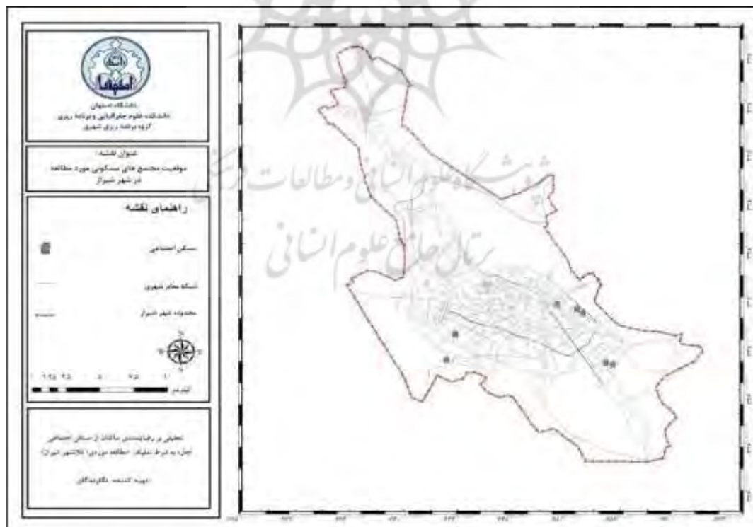
شکل - ۳: موقعیت مجتمع‌های مسکونی مورد مطالعه در کلان شهر شیراز