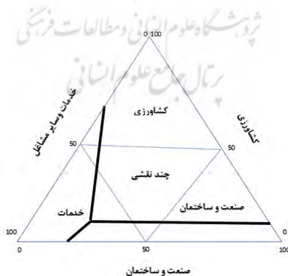
شکل - ۳: تعیین نقش اقتصادی شهر بهارستان

پس از تعیین نقش شهر بهارستان متوجه می‌شویم که شهر بهارستان نقش خدماتی دارد و در ایجاد اشتغال در بخش صنعت و کشاورزی برای ساکنان خود موفق نبوده است.