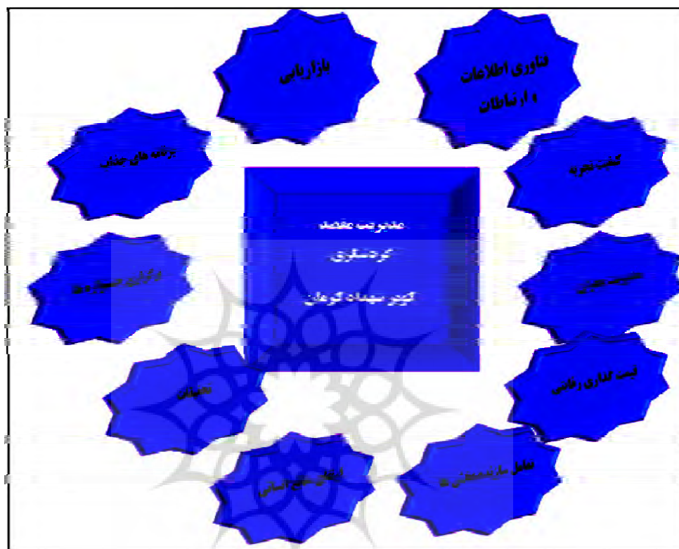
شکل ۴: متغیرهای مؤثر بر مدل کیفیت مدیریت مقصد گردشگری کویر شهداد

انسانی درگیر در حوزه گردشگری و نیز ایجاد تعامل سازنده و دوطرفه میان بخش خصوصی، دولتی و