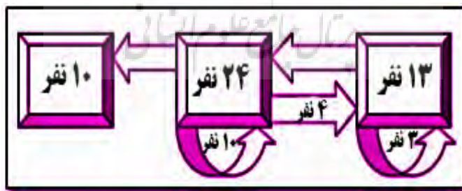
شکل ۳: چگونگی انتخاب اعضای پانل دلفی با روش زنجیره‌ای

بر این اساس پرسش‌هایی با توجه به شاخص‌های مدل کراچ و ریچی تهیه شد که با نظر گروهی شامل ۵ نفر از مدرسان با سابقه با مرتبه علمی دانشجویی به بالا دارای اشراف به گردشگری بیابان و کویر و آشنا به کویر شهید مورد روایی‌سنجی قرار گرفتند. پرسشنامه‌ها به گونه‌ای طراحی شد تا مخاطبان ضمن استنباط و فهمیدن مسأله مطرح‌شده، واکنش‌های فردی خود را بروز دهند. در پرسشنامه‌ها برگشت،