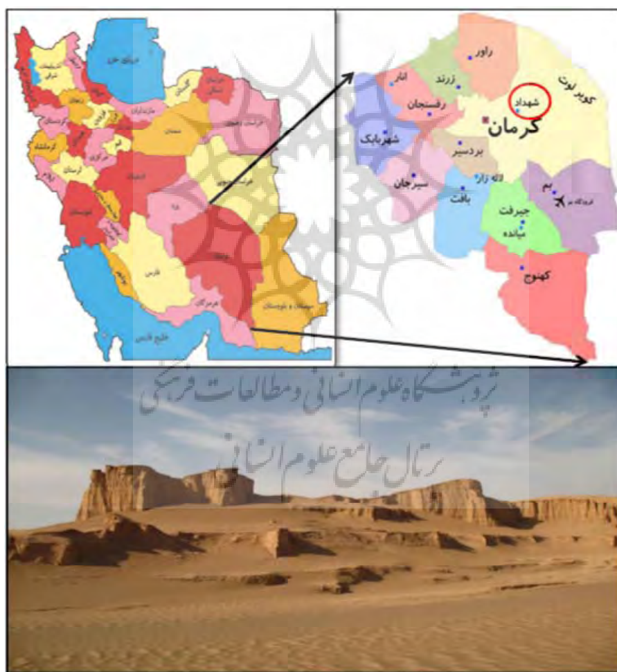
شکل ۵: موقعیت منطقه مورد مطالعه

استان کرمان با وسعت بیش از ۱۸۰ هزار کیلومتر مربع در جنوب شرقی ایران بین ۵۳ درجه و ۲۶ دقیقه تا ۵۹ درجه ۲۹ دقیقه طول شرقی و ۲۵ درجه و ۵۵ دقیقه تا ۳۲ درجه عرض شمالی واقع شده است. این استان از شمال به استان‌های خراسان جنوبی و