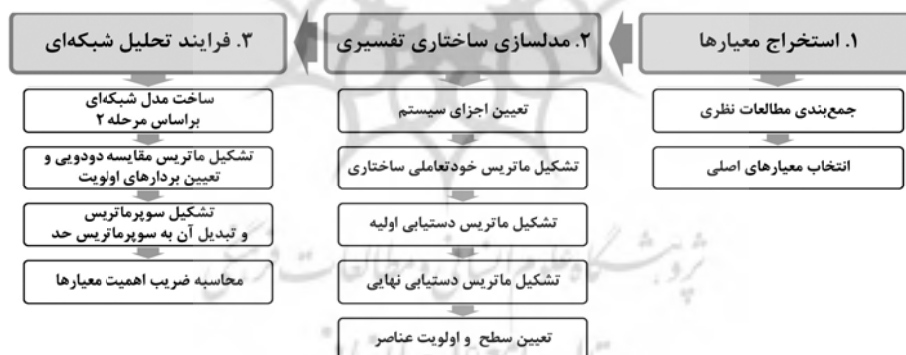
شکل ۱. روشن ساخت مدل ارزیابی کیفیت طرح

انتخاب گشته‌اند که امکان تحلیل و سنجش آن از مورد مطالعاتی، ممکن باشد. در مرحله دوم، معیارهای اصلی انتخاب شده به عنوان ورودی مدل‌سازی ساختاری تفسیری استفاده شده‌اند. محاسبات این مرحله با نرم‌افزار Excel صورت گرفته است. خروجی این مرحله، ساخت مدلی شبکه‌ای از معیارهای اصلی برای ارزیابی کیفیت طرح است. این مدل، به عنوان ورودی مرحله سوم، یعنی فرایند تحلیل شبکه‌ای استفاده شده است. هدف از این مرحله، محاسبه میزان اهمیت هر یک از معیارها و همچنین میزان توجه طرح مورد مطالعه به هر یک از معیارها بوده است. محاسبات و نتایج نهایی این مرحله نیز با نرم‌افزارهای Super Decisions و Excel انجام گه است. گفتنی است موضوع ارزیابی کیفیت هر طرح، به طور عام، نوعی روش ارزیابی ذهنی محسوب می‌شود و در اغلب پژوهش‌های جهانی آن نیز تحلیل و استنتاج پژوهشگران مبنای قضاوت قرار داده شده است. از این رو، در این پژوهش نیز مراحل ساخت مدل شبکه‌ای معیارها و امتیازدهی آنها بر مبنای نتایج پژوهش‌های پیشین و امتیازدهی میزان توجه طرح مورد مطالعه به معیارها بر مبنای تحلیل محتوای طرح (مهندسان مشاور نقش جهان-پارس، ۱۳۹۰: ج ۱ و ۸) و ارائه دلایل و استنتاج آنها بوده است.