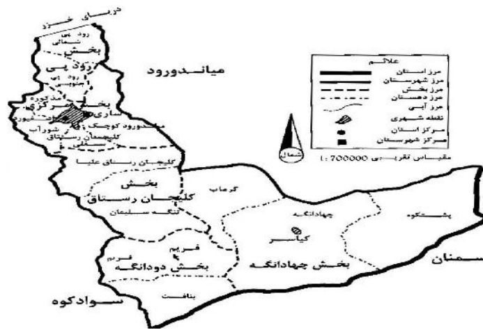
شکل ۱- موقعیت جغرافیایی شهرستان ساری.