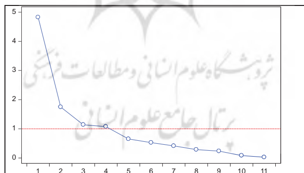
نمودار ۱- نمودار اسکری پلات برای شاخص بانکداری کشورهای در حال توسعه

نمودار شماره ۱، تغییرات مقادیر ویژه را در ارتباط با ۱۱ عامل برای شاخص بانکداری در کشورهای در حال توسعه نشان می‌دهد. همان‌طور که از نمودار مشخص می‌شود، ۴ عامل نخست ارزشی بیشتر از یک دارند و تعداد عامل‌های مدنظر از بین این ۴ عامل انتخاب می‌شود.