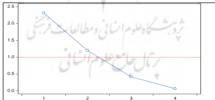
نمودار ۴- نمودار اسکری پلات برای شاخص بازار سهام کشورهای پیشرفته

نمودار شماره ۴، تغییرات مقادیر ویژه را در ارتباط با ۴ عامل برای شاخص بازار سهام در کشورهای پیشرفته نشان می‌دهد. همان‌طور که از نمودار مشخص می‌شود، ۲ عامل نخست ارزشی بیشتر از یک دارند.