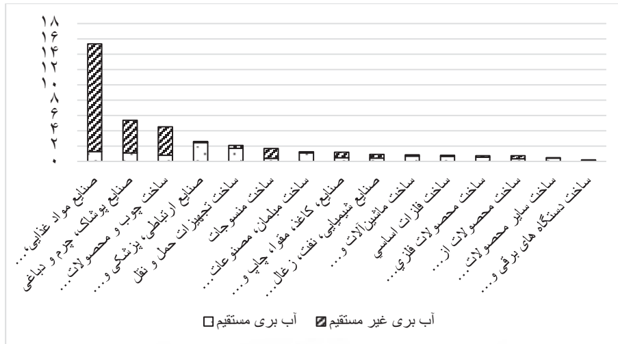
نمودار ۱- آب‌بری مستقیم و غیرمستقیم صنایع استان یزد در سال ۱۳۹۰