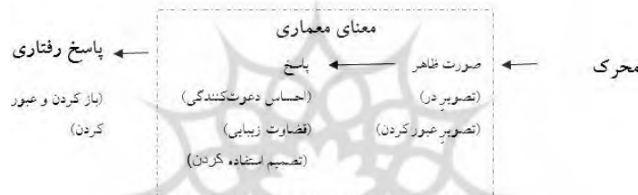
شکل شماره ۲: نظریه واسطه ای شناخت رابرت هرشبرگر (۱۹۷۴)

پیروان مکتب کنش متقابل براین باورند که با وقوع ادراک، معنا نیز درک می شود و برای دادن معنایی جدید، تجربه ی گذشته در ادراک مداخله می کند. تحلیل درون -نگر می گوید که معانی قبلاً به وجود آمده اند. روانکاوان ویژگی ناخودآگاه ذهن را در نظر می گیرند، که خاطراتی در آن ثبت و توسط روان بیدار نگه داشته می شوند. (لنگ: ۱۳۸۶، ۱۰۹). در این میان برای درک و اهمیت معماری محیط به نظریه واسطه ای شناخت رابرت هرشبرگر را می توان ارائه داد. هرشبرگر پنج سطح معنا را تشخیص داده است. اول معنای ظاهری است. که شامل ادراک شکل و فرم می باشد؛ دوم معنای رجوع کننده؛ سوم معنای عاطفی؛ چهارم معنای ارزشیابانه و این که آیا چیزی خوب است یا نه؛ و سطح پنجم معنای تجویزی است. تفاوت قابلیت محیط با مفهوم معنای تجویزی این است که اولی به امکانات رفتاری ساختار محیط بازمی گردد و دومی با اتکا به ساختار محیط به درجه ای از اجبار در رفتار دلالت می کند.