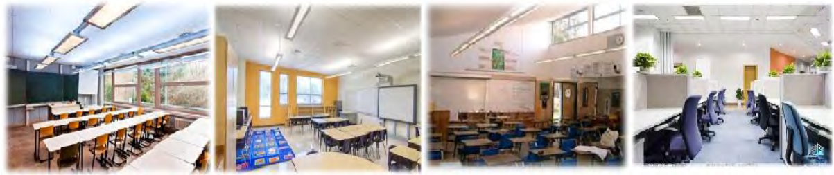
شکل شماره ۳: نورپردازی در معماری داخلی

معلمان، جلوگیری از یکنواختی محیط با تغییرات مناسب نور، تأثیرات فیزیکی که باعث بالابردن کارایی و فعالیت بدنی آنها می شود، ایجاد سرزندگی و شادابی و تأثیر مثبت بر جنبه بهداشتی (جسمی و روانی) دانش آموزان می شود (بابائی فر و نیک پور، ۱۳۹۴).