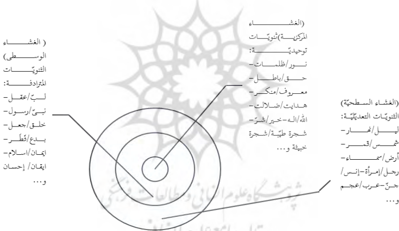
(الشكل ٢ - الطباقات القرآنية)

كما يبدو من الصورة، هناك ثلاثة غشاءات، الغشاء المركزية التي تشتمل على الطباقات التوحيدية وتقع في حقل السيميولوجية بمعنى أنّها من عمل الذهن البشرى فالبشر بواسطة الذهن وعبر اللغة يخلق عالماً فيه أنواع المنكرات مثل الشرّ والخبث. اختيار كلّ هذه المفاهيم في مركز الدائرة بيد الإنسان وهنا يظهر فرق الإنسان وسائر المخلوقات أمّا الغشاء المركزية التي اختصاصها بالثنائيات المترادفة فتقع أيضاً في حقل علم اللغة والسيميولوجية. كما تقدم الحديث عنه عند الاهتمام بموضوع ترجمة القرآن الكريم. الغشاء السطحية التي جعلنا الطباقات التعديلية ضمنها فتقع في الحقل الكاسمولوجي، حيث إنّها من مخلوقات أو مجعولات الله تعالى والبشر مجبورون في قبولها أو عدم قبولها فالإنسان غير مختار في تعيين جنسيته أو هو