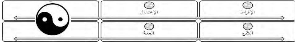
(الشكل ١ - مدل أرسطوي)