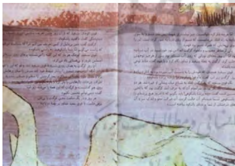
تصویر شماره‌ی ۲۱

نداشته باشد، ترجیح می‌دهد به دورانی در گذشته که اضطراب کمتری در آن داشته بازگردد. امن‌ترین دوران زندگی، دورانی است که جنین در رحم مادر بسر می‌برد. بازگشت به آب بازگشت به امنیت دوران جنینی است. ژرفای آب، همچنین، نماد ناخودآگاه است و کوه یخ فروید را به ذهن می‌آورد؛ بدین ترتیب، تصویرگر ژرفایی روان‌شناختی به شخصیت کرگدن می‌افزاید. زمانی که کرگدن برای بار نخست قو را می‌بیند، با تصویر زیر مواجه می‌شویم: