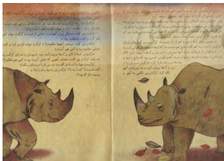
تصویر شماره‌ی ۱۶

تعامل و ارتباطی بین آهو و کرگدن نیست. همان‌طور که پیشتر گفته شد، آهو هشیار است و کنشگر، حضور کرگدن را درمی‌یابد و می‌گریزد. کرگدن اما در حال حرکت هم چشمانش را بسته و بی‌آنکه آهو را دیده باشد با تبختر وارد صحنه می‌شود؛ درحالی‌که برگ‌های پاییزی بر هر دوی آن‌ها می‌بارد. در ابتدا نیز، گفته شد بین آهو و کرگدن جوان ارتباط و تعاملی وجود ندارد و این نکته در این تصویر نیز نمود پیدا می‌کند؛ وقتی در متن واژگانی از آهو و کرگدن جوان سخن به میان می‌آید، در تصویر یا آهو در صحنه نیست، یا کرگدن جوان نیست، یا هر دو هستند و از هم دورند و یا هیچ کدام نیستند؛ بدین ترتیب، واژه و تصویر در نشان دادن ارتباط آهو و کرگدن جوان تقابلی دارند؛ آهو و کرگدن جوان در متن واژگانی باهم دیدار می‌کنند؛ اما متن تصویری، مانع دیدارشان می‌شود. کرگدن جوان، درحالی‌که به دنبال آهو می‌گردد، با کرگدن پیر روبه‌رو می‌شود (تصویر شماره‌ی ۱۶):