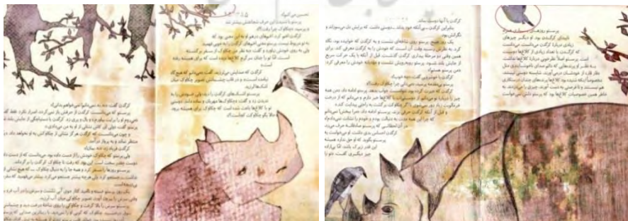
تصویر شماره‌ی ۲۶

گفت‌وگوی کرگدن با پرستو، در صفحات پنج و شش، و هفت و هشت، درحالی اتفاق می‌افتد که پرنده‌ی سبز و آبی که در صفحات یک و دو از بالا به کرگدن می‌نگریست، کماکان در صحنه حضور دارد. چکاوک در این قسمت از روایت واژگانی، حضور فیزیکی در داستان ندارد؛ اما در روایت تصویری، نیمی از بدنش در سه گستره‌ی پایایی پیداست (تصویرهای شماره‌ی ۲۵، ۲۶ و ۲۷). حضور و عدم حضور چکاوک در متن تصویری و واژگانی، پارادوکسی را رقم می‌زند که غم فراق را که از درون مایه‌های این داستان است قوت می‌بخشد: