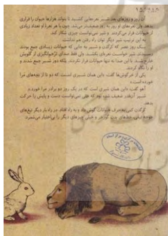
تصویر شماره‌ی ۹