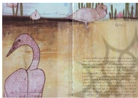
تصویر شماره‌ی ۲۲

در صفحات زیر (تصویر شماره‌ی ۲۲) به حضور شخصیت کانونی‌ساز پی می‌بریم: