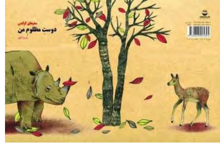
تصویر شماره ۱۰

درختی خزان‌زده در میانه ایستاده و تنه‌ی آن دو شاخه شده است. آهو سمت راست (پشت جلد) و کرگدن که نیمی از بدنش ناپیداست، سمت چپ (روی جلد) ایستاده است. عنوان، دوست مظلوم من، بالای سر کرگدن تایپ شده و خواننده می‌پندارد آهو، احتمالاً، دوست مظلوم کرگدن است. داستان با رفتن آهو آغاز می‌شود، با واکنش منفعلانه‌ی کرگدن ادامه می‌یابد و با افکار آهو پیش می‌رود. در آغاز کتاب، تصویر کرگدنی را می‌بینیم که سنگی بزرگ در آغوش گرفته و پشت به درخت خرمالو خوابیده است (تصویر شماره‌ی ۱۱).