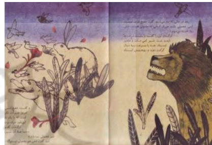
تصویر شماره‌ی ۶