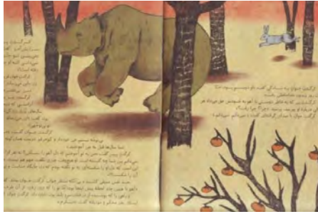
تصویر شماره ۱۷

آشکار می‌کند که در متن واژگانی آن‌چنان محسوس نیست؛ بدین ترتیب، می‌توان گفت ارتباط بین واژه و تصویر تا حدودی گسترشی و افزایشی است.