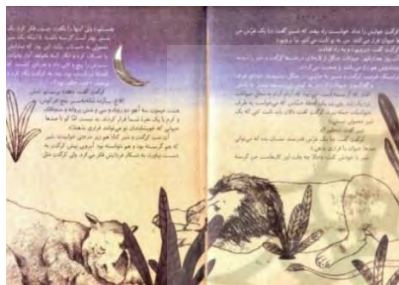
تصویر شماره‌ی ۷

۶-۳-۲. واژه و تصویر دست‌دردست هم چه می‌گویند؟ تصویرگری این کتاب تغییری را در شخصیت شیر نمایان می‌سازد و تغییر شخصیت شیر، لایه‌ای به درون‌مایه‌ی داستان می‌افزاید. چهره‌ی شیر در تصویرهای ابتدا و انتهای کتاب متفاوت است و اخم و خشونتش، رفته‌رفته، جای به دودلی، ضعف و ندامت می‌دهد. نگاهی به تصویر شیر (تصویرهای ۹ تا ۶) در طول داستان، تغییر شخصیت او را بر خواننده آشکار می‌سازد: