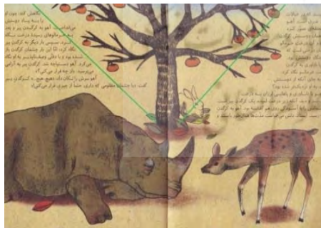
تصویر شماره‌ی ۱۲

سنگ و درخت هر دو نمادهای سکون هستند. کرگدن با دلبستگی کودکانه‌ای سنگ سرد و نفوذناپذیر را در آغوش گرفته است؛ گویی سنگ سرد و سخت، همزاد و همذات او باشد. تصویری از آهوی کنشگر در دو صفحه‌ی آغازین کتاب نمی‌بینیم. تصویرهای کتاب را که بنگریم می‌بینیم کرگدن جوان و آهو در کنار هم قرار نمی‌گیرند؛ حتی زمانی که