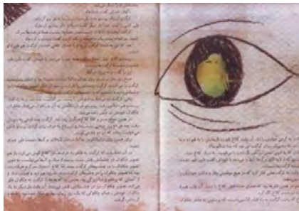
تصویر شماره‌ی ۲۴

کلوزآپ چهره‌ی کرگدن تأکیدی است، بر کنش و تنش درونی او و احساساتی که در دل پنهان داشته است، هر چند ما این احساسات را غیرمستقیم و از زاویه‌ی دید شخصیت کانونی‌ساز، یعنی پرستویی، می‌بینیم که قضاوتگر، بدبین و سرسخت