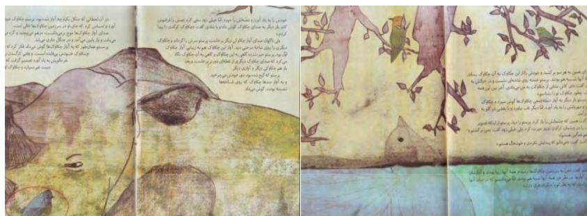
تصویر شماره‌ی ۲۸

وقتی پرستوی سیاه و سفید و خاکستری، کنار جوی آبی می‌نشیند و به کرگدن می‌اندیشد و آواز چکاوک را می‌شنود، باز هم در تصویر کلوز آپ، چهره‌ی غمگین کرگدن را در کنار پرنده‌ی آبی‌رنگ می‌بینیم که البته تصویری است که پرستو، از کرگدن در ذهن دارد (تصویر شماره‌ی ۲۷):