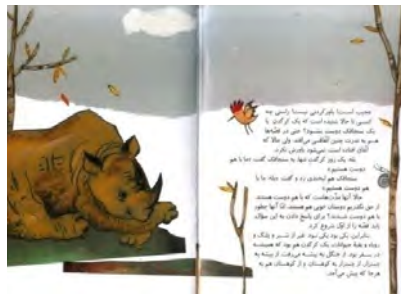
تصویر شماره‌ی ۱

در صفحه‌ی هفت و هشت، کرگدن با خرگوش همسفر می‌شود، کرگدن، گردن کشیده و سرخوش که همسفری «به سفیدی برف» دارد (نک: همان: ۸) و خرگوش با آرزوی یافتن هویج بر پشت کرگدن جا خوش کرده است: هویج‌های رؤیایی خرگوش سفید که نوک تیزشان به سمت پایین است، گویی شکل بازگونی‌ی شاخ کرگدن هستند که نوک تیزش به سمت بالاست. بالن آرزوی خرگوش، سرخوشی کرگدن را انگار به سخره می‌گیرد. در متن، با گفت‌وگوی کرگدن و خرگوش به هدف خرگوش پی می‌بریم و در تصویر شماره‌ی ۲، بالن آرزوی خرگوش و شاخ کرگدن و تقارن بازگونی‌ی خطوط و زوایای آن‌ها، عدم سنخیت این دو همسفر را بر ما آشکار می‌کند. پاهای کرگدن روی سطح شیبدار است و نه بر خط افق و اگر چنین باشد، موقعیت مذکور دلالت بر لغزندگی رابطه‌ی خرگوش و کرگدن دارد. ارتباط متن و تصویر در این مورد افزایشی است.