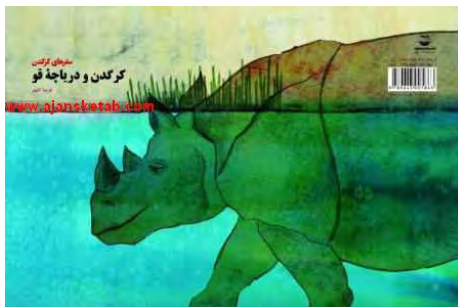
تصویر شماره‌ی ۲۰

آنچه روی جلد می‌بینیم، کرگدنی است که تا نیمه در آب دریاچه فرو رفته است. لبخند کرگدن زمانی که به اعماق آب می‌رود، یکی از مکانیزم‌های دفاعی را که فروید آن را بازگشت ۱ می‌خواند، به ذهن متبادر می‌کند. زمانی که فرد یارای مقابله با تنش‌های زمان حال را