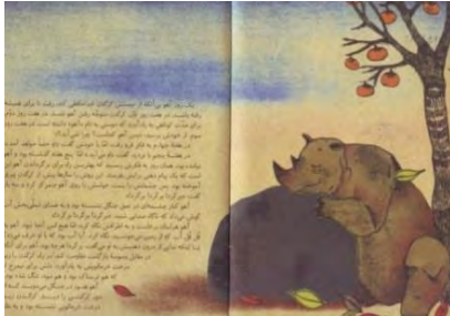
تصویر شماره ۱۱