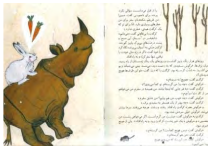
تصویر شماره‌ی ۲