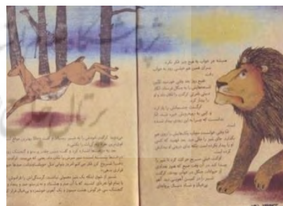
تصویر شماره‌ی ۸

شخصیتی که در روایت واژگانی، داستان را می‌بندد، کرگدن است که خونسرد و سرخوش به شمارش ادامه می‌دهد و این معما را در ذهن خواننده برجا می‌گذارد که دستاورد کرگدن چه بود یا افول شیر چه فایده‌ای داشت؟ شیری که در پی تأیید گرفتن از کرگدن است، از ضعف و گرسنگی ناتوان می‌شود. گرسنگی و زوال شیر، شاید به‌طور