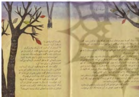
تصویر شماره ۱۸

می‌خواست؛ اما ظاهراً دیر شده و آهو دیگر حضور کرگدن جوان را در خلوت خود برنمی‌تابد.