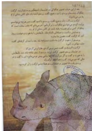
تصویر شماره ۲۹

پس از آنکه خواننده، با توجه به برهم‌کنش واژه و تصویر، درمی‌یابد آنچه پرستو در چشمان کرگدن می‌دید، تصویرهای ذهنی و فرافکنی‌های خود پرستو بودند، سخت می‌تواند دوباره به سخنان راوی درباره‌ی تصویری که این بار او در چشمان کرگدن می‌بیند، اعتماد کند. تصویر را هم که بنگریم، می‌بینیم نشانه‌ای برای اثبات حضور تصویر پرستو در چشم کرگدن نداریم. کرگدن کماکان داستانی معماگونه است که خواننده و بیننده می‌توانند خوانش خود را از او و از چشمانش داشته باشند.