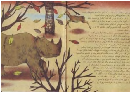
تصویر شماره‌ی ۱۵

کرگدن از چپ وارد شده و به سمت راست تصویر حرکت می‌کند و آهوی گریزپا، از سمت راست به چپ، دوان دوان خارج می‌شود. کرگدن، برخلاف خط داستان، از چپ به راست حرکت می‌کند؛ اما آهو در جهت داستان از راست به چپ می‌دود. داستان بیش از آنکه داستان کرگدن باشد، سفر آهو را روایت می‌کند.