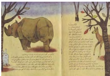
تصویر شماره ۱۴

تصویر روبرو قسمتی از داستان را نشان می‌دهد که کرگدن پیر پی می‌برد آهو دوستش را بدون خداحافظی رها کرده است (تصویر شماره ۱۴):