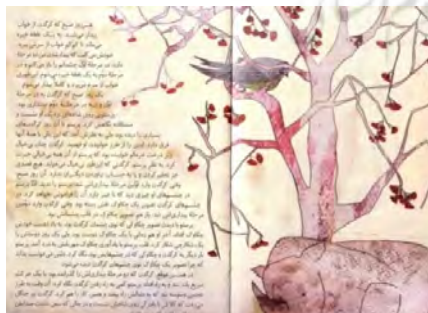
تصویر شماره‌ی ۲۳

۶-۶-۲. واژه و تصویر دست‌دردست هم چه می‌گویند؟ برهم کنش واژه و تصویر در این کتاب، روایت را به پیش می‌برد و با کاستن از و افزودن بر واژه‌ها، روایتی ظریف می‌آفریند. در صفحه‌ی اول و دوم کتاب که پرستو بر شاخه‌ای نشسته و کرگدن خفته‌ی داستان را از بالا نظاره می‌کند، پرنده‌ای را بر درخت می‌بینیم که بال و پری آبی و شکمی سبز دارد (تصویر شماره‌ی ۲۳):