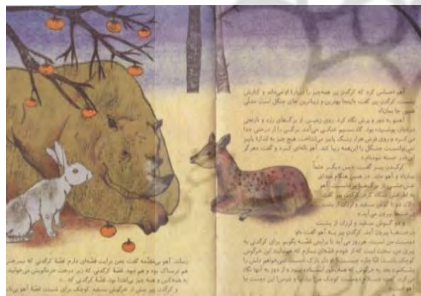
تصویر شماره‌ی ۱۳

جلد، دو شاخه نشده و قطور و یکنواخت است. چیزی نمانده که آهو و کرگدن پیر چهره بر چهره‌ی هم بسایند. نوشته‌ها طوری در صفحه قرار گرفته‌اند که خط شکسته‌ی هفتی شکلی ایجاد می‌کنند. هفت مانند فلشی چشم را به پایین هدایت می‌کند تا بیننده توجه خود را به تلاقی آهو و کرگدن پیر معطوف دارد. درختی که در میانه آمده و میوه‌های رسیده و خوش‌آب‌ورنگ دارد، بیننده را به یاد نقاشی‌های آدم و حوا و درخت دانش و میوه‌ی ممنوعه می‌اندازد (۲) . در روایت مسیحیت از هبوط، حوا کنجکاو می‌شود و میوه‌ی ممنوعه را می‌خورد و به آدم می‌خوراند. آهو که حتی واج‌های نامش به واج‌های نام حوا شبیه است، همانند حوا هشیار و کنجکاو است و کرگدن مانند آدم در به‌دست‌آوردن تجربه، یک قدم، از حوا/آهو عقب است؛ البته کرگدنی که در این صحنه می‌بینیم، کرگدن پیر است و احتمالاً پدر کرگدنی است که آهو دل در گرو مهرش دارد. در ادامه‌ی داستان، درمی‌یابیم که کرگدن پسر را کرگدن پدر آموزش داده است؛ اما حلقه‌ی مفقوده‌ای در ارتباط پدر و پسر به چشم می‌خورد؛ پدر ادعا می‌کند آموزش‌های لازم را درباره‌ی عشق و دوستی به پسر داده؛ ولی پسر ظاهراً چیزی از این آموزش‌ها به یاد نمی‌آورد. همین‌که آهو می‌نشیند و قصه‌گو می‌شود و تعامل بین شخصیت‌ها قوی می‌شود، درخت که تاکنون نقش جداسازی فضاهای تصویر را بر عهده داشت، از مرکز تصویر به حاشیه رانده می‌شود (تصویر شماره‌ی ۱۳):