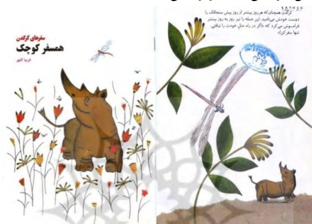
تصویر شماره‌ی ۴

کتاب و شروع سفر هدایت می‌کند. در صفحه‌ی پایانی، اما، سنجاقک بیشترین حجم صفحه را اشغال می‌کند؛ کرگدن و سنجاقک، در امتداد هم، رو به سوی یکدیگر دارند و هر دو به نظر می‌رسد از چپ به راست حرکت می‌کنند؛ گویی از پایان به آغاز بازمی‌گردند و این چرخه به پایداری دوستی این دو اشاره دارد؛ بدین ترتیب، تصویر، واژه را تفسیر می‌کند و ارتباطی افزایشی با آن برقرار می‌کند.