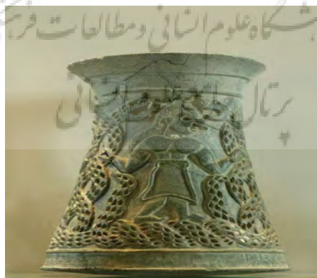
تصویر ۴: ظروف سنگ صابونی بدست آمده از تپه یحیی (همان)