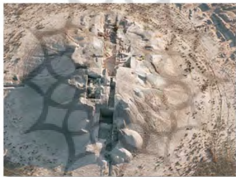
تصویر ۳: تصویر هوایی از تپه یحیی در شرق ایران (سید سجادی، ۱۳۸۷: لوحه ۱۹)

از طرفی جام هایی از سنگ صابون در اشکال و بن‌مایه‌های گوناگون در محوطه های باستانی بین النهرین مانند کیش، تل اسمر، خفاجه و اور و در موهنجودارو به دست آمده‌اند و نیز بیش از ۱۵۰۰ قطعه سنگ صابون به شکل اشیای تمام شده یا ناقص در یک معدن تقریباً ۲۵ کیلومتر دور از تپه پیدا شده که این نظریه را تایید می‌کند که تپه یحیی مکانی برای ساخت و صدور اشیاء ساخته شده از سنگ صابون بوده است (تصویر ۳). باید اضافه کرد که سفال این ناحیه با نمونه های یافته شده در بمپور، شهر سوخته و تل ابلیس همسانی دارند و تا حدودی می‌توانند با سفال منقوش بلوچستان مقایسه شود. بنا به یک گزارش جزیره بحرین خط واسط تجاری بین مراکز تمدنی سند و ایران و بین النهرین بوده است. وجود سنگ توزین ساخته شده، دره سند در بحرین، مهر خلیج فارس در لوتال و غیره این مدعا را ثابت می‌کند (توسلی، ۱۳۷۸).