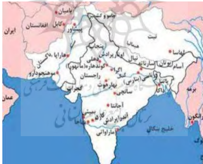
تصویر ۵: نقشه محوطه‌های مهم دره سند (هارت، ۱۳۸۲: ۴۹۸)

آثار فرهنگی کشف شده در قدیم‌ترین طبقات محوطه باستانی جلیل پور در پنجاب مرکزی را می‌توان به اواخر هزاره چهارم ق.م نسبت داد. این دهکده‌ها از نظر اندازه کوچک‌اند و ساختمان‌های آن‌ها عموماً با گل و گاهی خشت ساخته شده است. بیش از ۸۰ درصد سفال‌های پیدا شده در قدیم‌ترین طبقات شناخته شده امری IA و جلیل پور I در جنوب و مرکز سند دست سازند. درصد کوچکی از سفال‌ها با چرخ سفالگری کند ساخته شده است. در ایران محوطه‌هایی چون حصار IA-IC، سیلک III، شوش A-C و گیان VC با فرهنگ‌های مذکور پاکستان بویژه بلوچستان معاصر است. مواد و آثار به دست آمده از ایران با آنچه از بلوچستان پاکستان به دست آمده بیشتر همسانی دارد. برای مثال جامهای پایه‌دار و فنجان‌ها و نقوش تزئینی مانند ردیف جانوران و خطوط عمودی در سور جنگل و کیلی گل محمد پیدا شده بسیار شبیه آثاری است که از حصار و سیلک کشف شده است (سید سجادی، ۱۳۸۸: ۲۶۲). در حالت کلی می‌توان اذعان داشت مواد فرهنگی بسیاری از محوطه‌ها در دو منطقه مهم ایران و هند اشتراکات بسیاری با یکدیگر داشته‌اند (تصویر ۵ و ۶).