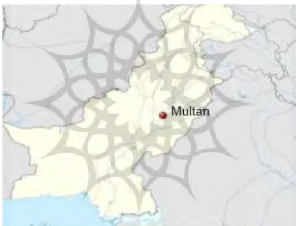
تصویر ۷: موقعیت شهر مولتان در ایالت پنجاب (محمدی، ۱۳۸۵: ۴۵)

فرمانروایی‌اش در غرب هندوستان قرار داشت و کل سرزمین شرق رودخانه سند را به همراه منطقه کوهستانی در سرزمین ساحل غربی آن و بلوچستان پاکستان را شامل می‌شد (Jacobs 1994:243). موقعیت جغرافیای ساتراپی هیندوش براساس نظر آرنولد توین‌بی در کتاب جغرافیای اداری هخامنشیان از شمال با ساتراپی تنگوش هم مرز بوده و تا ایالت پنجاب امروزی در پاکستان ادامه داشته است. به عبارت دیگر تا حوالی شهر مولتان ساتراپ هیندوش را تشکیل می‌داده است. (۱۳۷۹: ۱۲۲). به نظر می‌رسد ساتراپی هند دوره هخامنشی در سه ایالت بلوچستان و بخشی از ایالت پنجاب پاکستان تا حدود شهر مولتان (Multan) امروزی در ایالت سند پاکستان قرار داشته و نام ساتراپی هخامنشی هیندوش از این منطقه گرفته شده است.