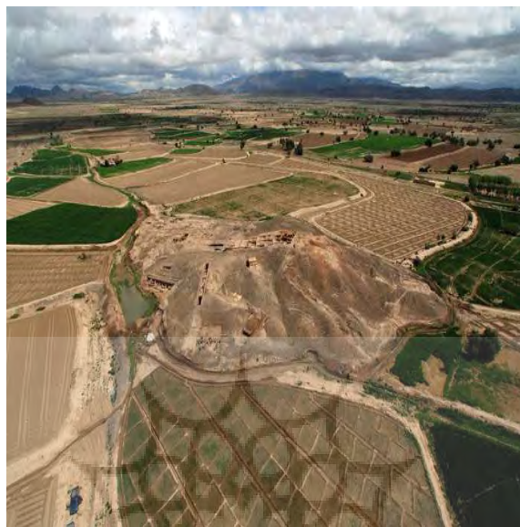
تصویر ۲: موقعیت محوطه دوره نوسنگی مهرگره دره سند در پاکستان (محمدی، ۱۳۸۵: ۴۵)

یکی از مهمترین محوطه‌های شرق ایران که مدارک مهمی از روابط تجاری- فرهنگی ایران با ملل شرق در اختیار قرار می‌دهد، تپه یحیی است (تصویر ۳). داده‌های باستان‌شناختی این محوطه باستانی ثابت کرده است که تپه یحیی نقش مهمی در توزیع و کنترل منابع طبیعی سنگ صابون در شرق و غرب داشته است. در دوره بعدی یعنی سال‌های ۳۴۰۰ تا ۳۲۰۰ ق.م تولید سفال نوع نال، که مدت‌ها در تمدن هاراپایی وجود داشته، در این منطقه متداول بوده است (توسلی، ۱۳۷۸: ۴۸). باتوجه به اشیاء و مدارک فراوان یافته شده از تپه یحیی و مدارک موثق از محوطه‌های باستانی گسترده شده تا بین‌النهرین از یک سو و دره سند از جانب دیگر، می‌توان به روابط تجاری که عامل مهم پیوند دهنده جهان باستان و همچنین عامل گسترش تمدن‌های پیشرفته به نواحی دیگر بوده است. بی‌تردید میان شهر سوخته و سرزمین‌هایی که بیرون از مرزهای جغرافیایی سیستان واقع شده‌اند، اجناس نیمه‌قیمتی و محصولات دریایی، داد و ستد می‌شده است. مهمترین آن‌ها سنگ کبالت است که از معادتهای عظیم بدخشان استخراج می‌شده و به شهر سوخته انتقال می‌یافت. (توسلی، ۱۳۸۹: ۱۶).