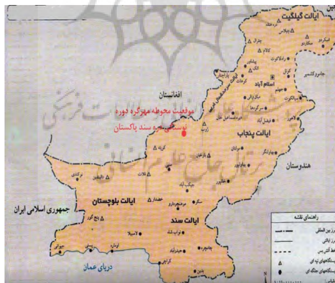
تصویر ۱: موقعیت محوطه دوره نوسنگی مهرگره دره سند در پاکستان (محمدی، ۱۳۸۵: ۴۵)

درحالی که سفالگری در هزاره ششم در ایران به صورت تکامل یافته وجود داشته، در بلوچستان پاکستان، قدیمی ترین محوطه باستانی یعنی کیلی گل محمد در کوئته و گوملا در گومل به ترتیب هنوز در هزاره های پنجم و چهارم به مرحله تولید سفال نرسیده بودند (سید سجادی، ۱۳۸۸: ۲۵۸).