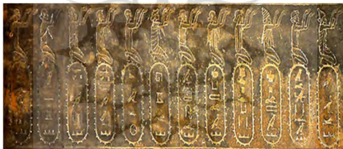
تصویر ۷: نام ملل به خط هیروگلیف از سمت راست ۱۳- بابلی ۱۴- ارمنی ۱۵- ساردی ۱۶- کاپادوکیه ای ۱۷- اسکودرای (مقدونی) ۱۸- آشوری ۱۹- هگور (عربی) ۲۰- کمی (مصری) ۲۱- لیبی ۲۲- نهسی (کوش یا حبشه) ۲۳- مکرانی ۲۴- هندی (Mysliwiec 1998:194)

ساکن در مسیر سند بود که پیش از آغاز عملیات نظامی لازم می‌نمود. ساتراپی جدید یا همان هندوش کتیبه‌های هخامنشی (تصویر ۷)، که تا بخش جنوبی دره‌ی سند در پاکستان کنونی گسترده بود، شرقی‌ترین استان امپراتوری هخامنشی بود (داندامایف، ۱۳۸۱: ۱۹۱). پارسها در حدود سال ۵۱۲ ق.م از روی رودخانه سند گذشته و قسمتی از غربی را ضمیمه امپراتوری هخامنشی نمودند. داریوش برای شناسایی دستور ساخت کشتی‌هایی را صادر کرد تا از منطقه فتح شده به دریای عمان روانه کند. تسخیر پنجاب و دره سند برای ایران زمان داریوش اول مهم بود، زیرا هند از زمانهای خیلی قدیم کشوری ثروتمند و پر جمعیت به شمار می‌رفت. بعد از تسخیر هند طلای زیادی همه ساله از هند به ایران ارسال می‌شده است. اهمیت استیلای ایران در این زمان بر قسمت‌هایی از هند به اندازه‌ای در تاریخ عهد قدیم هند مهم بوده که هندی‌ها زمان موعظه بودا و این لشکرکشی را دو مبدا برای تعیین تاریخ خود دانسته‌اند (پیرنیا، ۱۳۶۶: ۶۳۱).