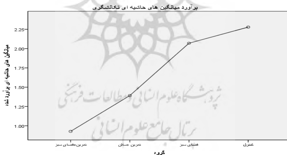
شکل ۱- برآورد میانگین حاشیه ای بیش جنبشی

کواریت اعمال شده در مدل در مقادیر زیر محاسبه شده اند: تکانشگری بیش آمون = 2.4375, پایین جنبشی بیش آمون = 4.8750, تمرکز بیش آمون = 4.9167, بی فراری بیش آمون = 13.8750