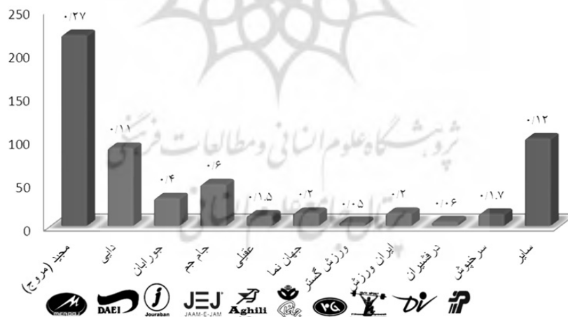
شکل ۲. فراوانی و درصد فراوانی برندهای انتخابی ایرانی