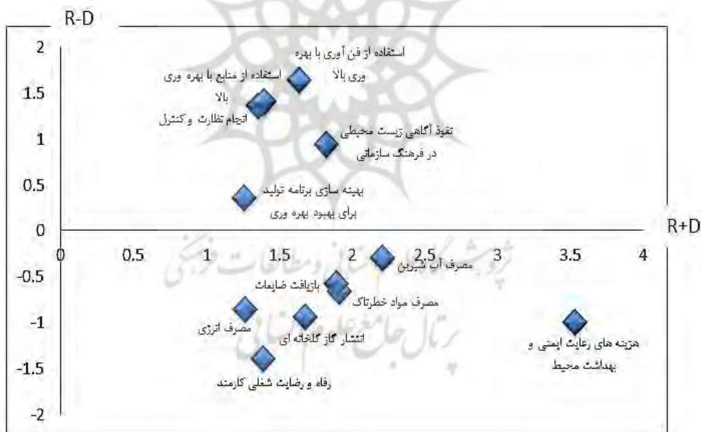
شکل ۳: نمودار روابط علی دیمتل

حال می توان نمودار علی دیمتل را با استفاده از مقادیر اثر گذاری کل و اثر گذاری خالص رسم نمود.