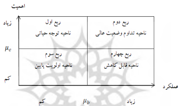
شکل ۱: ماتریس تحلیل اهمیت- عملکرد

چه میزان اهمیت برخوردار است؟ ب) عملکرد ارائه کننده خدمت یا محصول در ویژگی های مطرح شده از پرسشنامه چگونه بوده است؟ (بحرینی زاده و همکاران، ۱۳۹۳). اطلاعات مورد نیاز تحلیل اهمیت- عملکرد از پرسشنامه استخراج شده و میانگین یا میانه امتیازات اهمیت و عملکرد هر ویژگی محاسبه می شود و در نهایت این مقادیر به عنوان مختصات برای ترسیم ویژگی های جداگانه بر روی ماتریس دو بعدی به نام ماتریس اهمیت- عملکرد مورد استفاده قرار می گیرد (آذر و همکاران، ۱۳۹۵). شکل ۱، چهار ربع ماتریس تحلیل اهمیت- عملکرد را نشان می دهد.