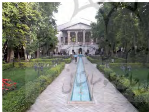
تصویر ۲: عمارت باغ فردوس و محوطه‌آرایی آن