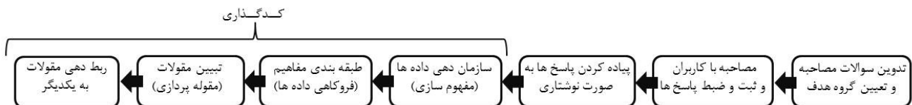
تصویر ۴: روش کیفی استخراج معنای باغ فردوس از طریق مصاحبه‌ها