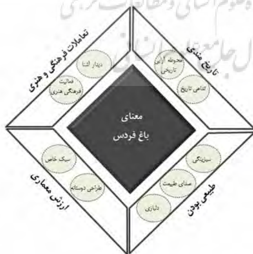
تصویر ۷: ابعاد معنای فضای شهری تاریخی باغ فردوس

مطالعات نشان می‌دهد که مردم مکان‌هایی را انتخاب می‌کنند که یا اهمیت تاریخی دارند یا جزء محوطه‌های تاریخی محسوب می‌شوند (Nasar 1998). مشارکت‌کنندگان در فضای شهری باغ فردوس نیز حس تداعی گذشته و قدمت‌مندی را مبنای اصالت بنا دانسته‌اند. تداعی گذشته و تاریخ‌مندی نه‌تنها در معماری و محوطه‌آرایی عمارت باغ فردوس (معماری قاجاری و الگوی باغ ایرانی) نمود یافته است، بلکه اختصاص کاربری موزه و امکان نمایش فیلم از تاریخ فیلم‌سازی ایران در فضای داخل عمارت نیز به «تداعی حس گذشته» کمک می‌کند. از سوی دیگر، کهن‌الگوی باغ ایرانی و خصلت آیینی‌ای از تیلور عالم مثل در عالم ماده است (کربن ۱۳۹۲) که به‌کاربردن عناصر تاریخی مرمت در محوطه‌آرایی باغ فردوس در درک فضای تاریخی به غنای فضا می‌افزاید. حفظ اصالت تاریخی فضای باغ فردوس در مرمت آن، به تجربه معنای نمادین و ارزشی برای مشارکت‌کنندگان در پژوهش منجر شده است. حس تاریخ‌مندی حتی می‌تواند باعث شکل‌گیری هویت مکانی از طریق خلق حس مکان یا مفهوم تداوم در زندگی فردی و یا جمعی افراد شود که در نهایت به دل‌بستگی مکانی می‌انجامد (Gustafson 2001; Twigger, Ross and Uzzel 1996).