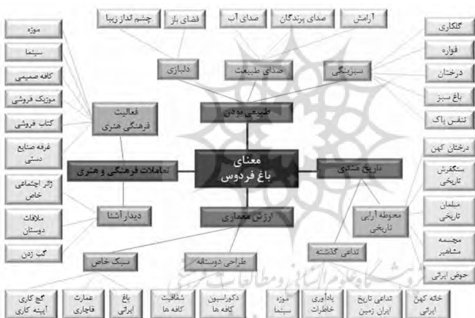
تصویر ۵: مدل معنای باغ فردوس

در پاسخ به پرسش اول پژوهش که «مخاطبان فضای باغ فردوس معنای مکان را چگونه ادراک می‌کنند»، فرایند استخراج تم‌ها و مقولات برآمده از این پژوهش مؤید این مطلب هستند که مشارکت‌کنندگان به‌طور کلی، معنای باغ فردوس را در قالب مقولات و تم‌های مفهومی تجربه کرده‌اند که در تصویر ۴ به آن اشاره شده است. وجود محوطه‌آرایی تاریخی بر تاریخ‌مندی این مکان دامن می‌زند. ماهیت باغ‌گونه این مکان سرسبز بر طبیعی بودن و وسعت معنای باغ فردوس، دل‌باز بودن، سبز بودن و شنیدن صدایی از جنس طبیعت تأکید دارد که موجب پررنگ شدن نقش طبیعی بودن باغ فردوس در اذهان افراد شده است. تعاملات فرهنگی هنری موجود در باغ فردوس موجب شده است که این مکان، جای مناسبی جهت دیدار دوستان و آشنایان و انجام فعالیت‌های فرهنگی هنری باشد. ارزش‌های معماری این مجموعه که به هر دو صورت تاریخی و مدرن وجود دارد، به‌دلیل طراحی دوستانه و سبک خاصی است که در باغ فردوس وجود دارد.