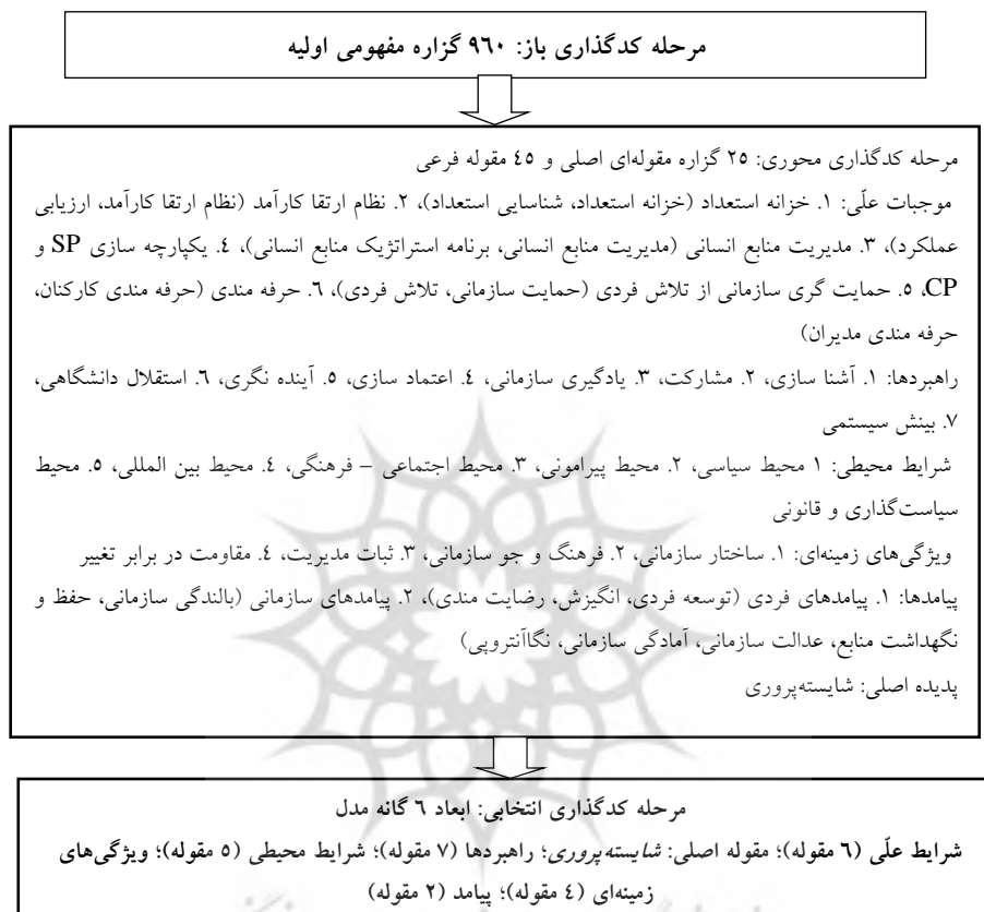
شکل ۱. فرآیند مدیریت داده‌ها و تکامل مدل در سه مرحله کدگذاری

شامل پیامدهای فردی، پیامدهای سازمانی) جای گرفتند. شکل ۱ فرآیند مدیریت داده‌ها و تکامل مدل در سه مرحله کدگذاری (باز، محوری و گزینشی) را نشان می‌دهد.