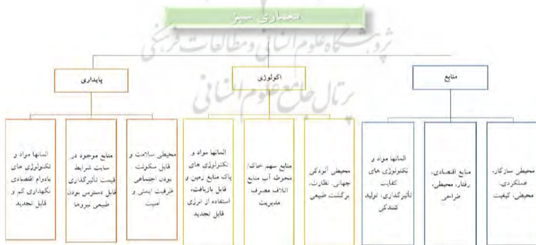
شکل (۱): طبقه بندی معماری سبز (رستمی و ایرانمنش، ۱۳۹۳)

این مفهومی است که نیازمند تأمین واژه‌های: پایداری، بوم‌شناسی (اکولوژی) و اجرا می‌باشد. اگر چه یک ارتباط محکم بین زیر واژه‌ها وجود دارد، با این وجود هر مقوله مستقل و به صورت دوجانبه منحصر به فرد می‌باشد. برای مثال، یک ساختمان ممکن است پایدار باشد ولی سازگار با محیط زیست نباشد، همچنان که یک ساختمان سازگار با محیط زیست باید ترکیبی از پایداری، سازگار با محیط زیست اجرا باشد سطح سبز بودن ساختمان بر اساس سطح ارتباط متقابل میان این سه مقوله تعیین گردد. (رستمی و ایرانمنش، ۱۳۹۳) معماری سبز، یا طراحی سبز، یک رویکرد برای طراحی و ساختن است که اثرات مضر بر سلامت انسان و محیط به حداقل می‌رساند. معمار یا طراح "سبز" با مواد و روش‌های ساختمانی سازه‌ای سازگار با محیط زیست انتخاب می‌کند و تلاش می‌کند تا از هوا، آب و زمین محافظت کند. (Roy, 2008).