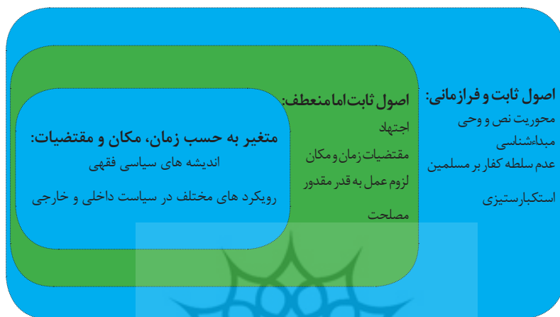
شکل اول: اصول ثابت و فرازمانی، ثابت اما منعطف و متغیر به حسب زمان و مکان

این تقسیم را می‌توان در قالب نمودار زیر تصویر کرد: