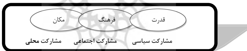
شکل ۱: انواع مشارکت بر حسب قلمرو فعالیت (نیک پی، ۱۳۹۰: ۵۵)

واژه مشارکت ۴ از نظر لغوی به معنی شرکت دو جانبه و متقابل افراد برای انجام امری است (ازکیا و غفاری، ۱۳۸۳: ۲۸۹). مشارکت در فارسی به معنای انبازی، دخالت، اصل علاقه‌مندی و توجه به مسأله است و به معنای «با خود داشتن»، «از نفس خویش چیزی از غیر داشتن» است. به طور سنتی مشارکت به طور داوطلبانه یا اجباری در مسائل محلی، ایالتی و ملی در تصمیم‌گیری‌های دولتی می‌باشد (اصطلاح اجبار به معنای زور و خشونت نیست بلکه به معنای توافق اجباری با قوانین و مقررات می‌باشد (میلاکویچ ۵ ، ۲۰۱۰: ۲). در حوزه مسائل شهری نیز مشارکت شهروندان، سنگ زیربنای دموکراسی و اصطلاح روشنی برای قدرت شهروندان است (منج ۶ ، ۲۰۰۸: ۳۳).