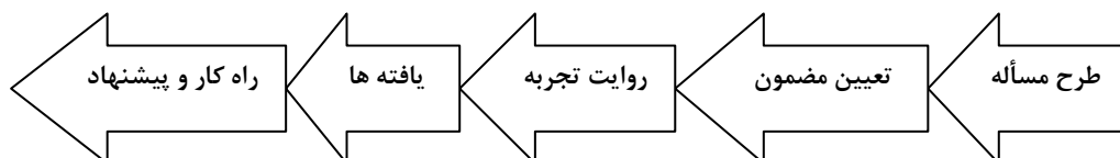
شکل ۱: روش کلی گردآوری تجارب آموزشی

ابزار گردآوری اطلاعات، می تواند کاربرد، یادداشت، خاطره نویسی، فیلم، عکس و... باشد.