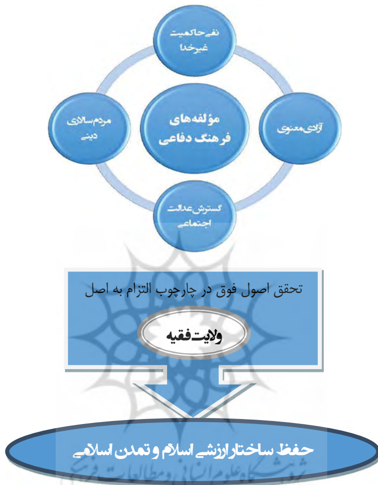
شکل شماره ۳: الگوی فرهنگ دفاعی در بستر تمدن اسلامی