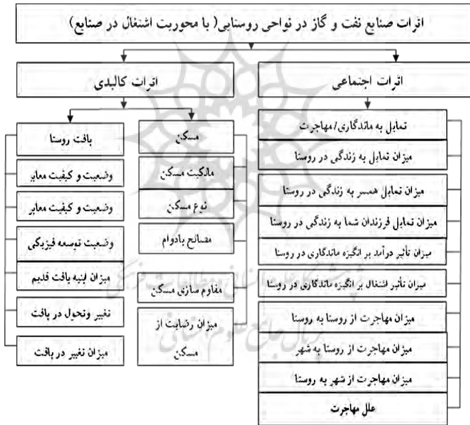
شکل شماره (۲): شاخص‌ها و متغیرهای تحقیق

در این قسمت شاخص‌ها و متغیرهای اصلی تحقیق تعریف و معرفی شده‌اند و برطبق متن و سوال‌های اصلی تحقیق فرضیه‌های این پژوهش به این شرح می‌باشد: بنظر می‌رسد استقرار صنایع نفت و گاز در محدوده مورد مطالعه (بخش تشان) باعث ارتقاء و تحول در شاخص‌های کالبدی روستاییان شده است. بنظر می‌رسد استقرار صنایع نفت و گاز (اشتغالزایی و درآمدزایی ناشی از آن) در افزایش انگیزه ماندگاری روستائیان و کاهش روند مهاجرت نقش موثری داشته است. از آنجا که آزمودن فرضیه‌ها نیاز به تعیین، نامگذاری و عملیاتی کردن متغیرها دارد (دلاور، ۱۳۸۸) در نمودار (۱) متغیرهای تحقیق آورده شده است. لذا متغیرها کمی و قابل اندازه‌گیری می‌باشند و برای سنجش اثرات اجتماعی و کالبدی صنایع نفت و گاز از طیف لیکرت (بسیار زیاد، زیاد، متوسط، کم، بسیار کم) استفاده شده است.