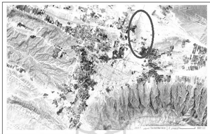
شکل شماره (۴): کاربری اراضی روستاهای ادغام شده در شهر