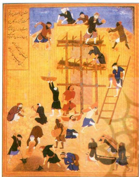
تصویر ۲- ساختمان کاخ خورنق، اثر کمال الدین بهزاد (تجوییدی، ۱۳۸۶:۱۲۲)

کمال الدین بهزاد نقاش دوره تیموری و صفوی، صاحب سبک و متعلق به مکتب نگارگری هرات (پسین) و نیز تبریز صفوی، مطمئناً یکی از تاثیرگذارترین استادان در این زمینه بوده است. چگونگی شکل گیری این مکاتب، با توجه به زمینه های هنری پیشین در ایران، رخدادهای تاریخی و نیز شرایط سیاسی، اجتماعی و فرهنگی زمان شکل گیری آنها، جالب توجه می باشد. بهزاد نتیجه ی مکاتب و جریان های هنری قبل از خود، شرایط اجتماعی زمان خود و تاثیر گذار بر مکاتب و سبک های بعد از خود بوده و اندیشه و هنرش - به مانند بسیاری از هنرمندان گذشته ی این سرزمین - جنبه ی ماورایی زندگی این جهان را بازمی نمایاند.