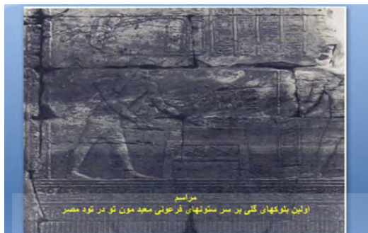
شکل ۱- اولین بلوک های گلی بر سرستونهای معبد فرعون مصر

ساخت در بیشتر شهرهای دنیا رواج یافت. از این روست که امروزه حداقل یک-سوم مردم این عصر در ساختمانهای گلی زندگی می کنند. برای اینکه این سنت های هزار ساله به دست ما برسد تمدن های شهری و روستایی متعددی فنون ساخت را همانند سازی، بازسازی و اصلاح کرده اند. بدین صورت این فنون توانسته اند مزیت ها، قابلیت های بالقوه ی تطبیق با شرایط جغرافیایی، فرهنگی و موقعیت های گوناگون را به اثبات برسانند. نمونه های بسیاری از معماری های گوناگون با خاک در تمامی قاره ها به چشم می خورد: یکی باقی مانده های باستان شناختی و تاریخی؛ دیگری شهرها و روستاهای بی شماری که روز به روز این میراث چند ساله ی سنت ها در آنها ابدی و ماندگار می شود، سنت هایی که در نتیجه تبادلات بین تمدن های مختلف باورتر شده اند. به نظر مرسد که وقایع اخیر، پس از بحران انرژی، ما را به ادامه چرخه ی حیات دوباره ی معماری های با خاک فرا می خواند. (شهرام پوردیهیمی، ۱۳۷۰)