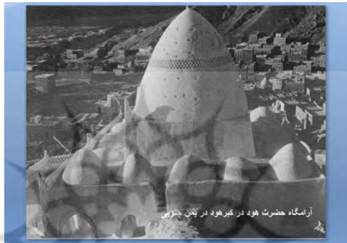
شکل ۳- آرامگاه حضرت هود در کبره هود در یمن جنوبی

باخاک، این ماده ساده، ابتدایی و در دسترس (زیرا ۷۴٪ پوسته زمین را تشکیل می دهد). معماران توانستند در سراسر دنیا معماری های متنوع و شگفت آوری به وجود آورند. این زبان متفاوت و در عین حال شیوای معماری از اصالت های فرهنگی استفاده کنندگان سخن می راند. بدین گونه ویژگی های هر منطقه در معماری با خاک آن تبلور می یابد. این معماری با تباین های ظریف و گونه گون، با شرایط خاص اجتماعی، اقتصادی، جغرافیایی و اقلیمی هر محل سازگاری و انطباق می یابد. هنر و مهارت به کارگیری خاک در قرون متمادی در تمامی قاره های جهان باعث شکوفایی سنت های عالمانه و عامیانه شده است. لیکن جنبه های ادراکی و توانایی این سنت ها نادیده گرفته شده و طی نیم قرن اخیر مورد تحقیر نیز وارد شده است. در حقیقت گروهی از نخبگان با دنبال کردن نظریه «پیشرفت به هر قیمت»، سبک جدیدی بنام سبک جهانی ابداع کردند. این روش به دلیل رواج این سبک بسیار از سنت های محلی را نادیده گرفت و دوره ای از تحقیر و فراموشی نسبت به سبک های مختلف هنرهای ملی را به همراه آورد. امروزه وظیفه ما باز جستن این میراث است ولی این امر با حسرت خوردن میسر نمی شود، بلکه باید بتوانیم پیوستاری بین سنت ها آینده ایجاد کنیم، آینده ای که اجازه ی ظهور دوباره این ویژگی های فرهنگی و توانایی های محلی را فراهم کند. (ابراهیم جعفرپور، ۱۳۶۷)