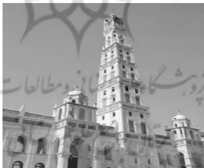
شکل ۷- برج بابل

آیا اولین (آسمان خراش) تاریخ ما از گل ساخته شد؟ تحقیقات اخیر باستان شناسانشان می‌دهد که (برج) معروف (بابل) در قرن هفتم ما قبل تاریخ در مرکز بابل با استفاده از این مصالح ساخته شده است. به نظر می‌رسد که ارتفاع آن تا طبقه هفتم به نود متر می‌رسیده است. در شهرهای متعددی در بین‌النهرین (زیگورات‌های) پلکانی وسیعی دیده می‌شود که ارتفاع آنها تا چهل یا پنجاه متر بوده است. این سنت‌های تاریخی از طریق سنت‌های مردمی که از خاک برای ساخت بناهای مرتفع خود بهره می‌جسته‌اند، هروزه به دست ما رسیده است. بناهای موجود در دره‌ها، قبل از صحرا بیابان در مراکش ویا قصرهای آن محل (کسبه‌ها) هنوز تا چهار طبقه ساخته می‌شود: در روستاهای سرخ‌پوستی امریکای شمالی و تائوس نیز وضع به همین منوال است. مناره‌های بلند مساجد در افریقا و خاورمیانه گویی جاذبه‌ی زمین را به تمسخر گرفته‌اند. از بین تمامی شهرهای ساخته شده از خاک در سراسر دنیا شهر شیپام در یمن شمالی به واسطه‌ی چیره دستی و مهارتی که در ساخت آن به کار رفته است از شگفت‌انگیزترین آنها به شمار می‌رود. گاهی اوقات آن را (منهتن صحرا) نیز می‌نامند، زیرا با تعداد پانصد ساختمان مانند جنگلی از آسمان خراش به نظر می‌رسد: این ساختمان‌ها ارتفاعی تا سی متر و هشت طبقه دارند. درست است که این سنت شهرسازی یمنی قدیمی است، ولی بیش از نیمی از آنها در قرن بیست ساخته شده است. این مساله نشان می‌دهد که مهارت شهرسازی موجود در یمن توانایی سازگاری با شهرسازی معاصر را دارد. (آرتور پوپ، ۱۳۶۵)