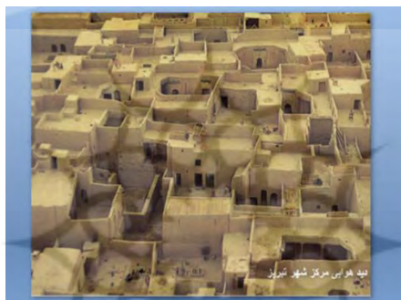
شکل ۵- دید هوایی از مرکز شهر تبریز

تمدن های گوناگون، در ساخت شهرهای خود از خشت خام، فراوان بهره می جستند. در سراسر دنیا از بعضی از آنها فقط بقایایی باستان شناختی به جا مانده است: از زرشو که بی شک اولین شهر تاریخ به شمار می رود و در حدود ده هزار سال پیش ساخته شده است گرفته تا کتل هیوک ترکیه، از هاراپا و موهنجو- دارودر پاکستان، تا اخلت آتون مصر، از چاچان در پرو تا بابل معروف در عراق، از مدینه الزهرا تا دروازه های کوردو در اسپانیا و خیر و کیفیا در کرت. گاه می بینیم که بر بنیان های باستانی، شهرهای جدیدی شکوفا شده است و ساخت و ساز با خاک همچنان در آنها ادامه دارد: لوگدونوم مرکز حکومت گل که اکنون تبدیل به شهر لیون سومین شهر بزرگ فرانسه شده است. پس از تصرف آمریکا به دست اسپانیایی ها شهرهای زیادی ساخته شدند که گواهی بر استفاده از خاک در شهرسازی به شمار می روند مانند سانتافه مرکز ایالت نیومکزیکو در ایالات متحده و یا شهر بوگوتا پایتخت کلمبیا. از آفریقا تا خاورمیانه زنجیره ی عجیبی از شهرهای خاکی می بینیم: کانو در نیجریا، آگادس در نیجر، تومبوکتو در مالی، اولاتا در موریتانی، مراکش در مغرب، آدرارد در الجزایر، قدامس در لیبی، سعدار یمن شمالی، شبام در یمن جنوبی و یزد در ایران. بر اساس این سنت های شهری، پروژه های جدیدی در دست احداث است که خواهان اصلاح روشهای معماری شهرسازی با خاک هستند: در آفریقا (در مراکش و یا روسو) در اروپا (در فرانسه شهر جدید ایسل دابو نزدیک لیون و یا آلمان شرقی) و در ایالات متحده (در سانتا فه یا آلبوکرک)