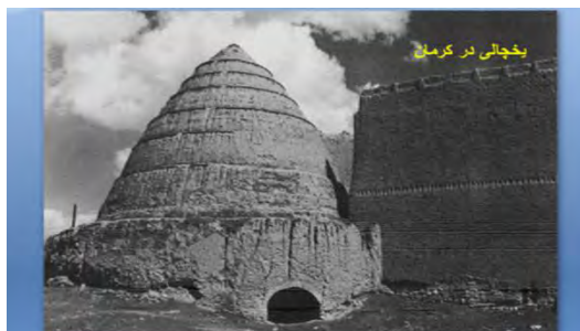
شکل ۴- یخچالی در شهر کرمان

در طول نیم قرن همه ی شرایط فرهنگی در جهت ترویج اصول خشک معماری نوین بود چنان که اغلب فراموش کردیم که معماری ملل سنتی چه قابلیت هایی در رفع مشکل مسکن به شیوه های محلی و خود جوش دارد. هنگامی که امروزه سخن از معماری با خاک می رانیم تصاویر «کلبه های ابتدایی» و «کلیشه ی «خانه های دور افتاده و محقر» به ذهن همگان متبادر می شود. اما واقعیت های موجود با این تفکرات قشری و قوم مدارانه کاملاً فرق دارد. خانه های گلی ساخته شده در سراسر دنیا از تنوع بسیار، مهارت فنی در ساخت و نبوغ هنری برخوردار هستند. علاوه بر ساخت خانه، این مصالح قابلیت ساخت گسترده ی متنوعی از ساختمانهای وسیع و کارآمد، عمومی و خصوصی، برای پیشرفت های معنوی و مادی جوامع شهری و روستایی را داراست: مساجد و کلیسا ها، سیلوها و انبارها، باروها و قلعه ها، آسیاب ها، آبراه ها و یخچال ها، میدان ها، دروازه های با شکوه، معابد و قصرها از این مجموعه ها است. (لئونارد بنه ولو، ۱۳۵۳)