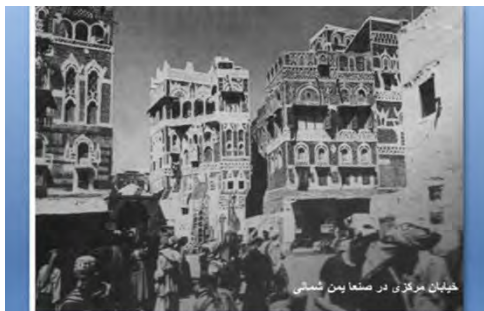
شکل ۶- خیابان مرکزی در صنعا یمن شمالی