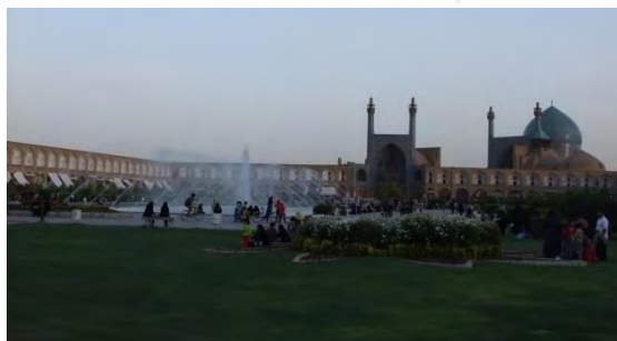
شکل ۲: نقشه و تصویر میدان نقش جهان

میدان نقش جهان همچنین معروف با نام تاریخی میدان شاه و پس از انقلاب ۱۳۵۷ ایران با نام رسمی میدان امام، میدان مرکزی شهر اصفهان است که در قلب مجموعه تاریخی نقش جهان قرار دارد. بناهای تاریخی موجود در چهار طرف میدان نقش جهان شامل عالی‌قاپو، مسجد شاه (اصفهان)، مسجد شیخ لطف‌الله و سر در قیصریه است. علاوه بر این بناها دویست حجره دو طبقه پیرامون میدان واقع شده است که عموماً جایگاه عرضه صنایع دستی اصفهان می‌باشند. میدان نقش جهان در تاریخ ۸ بهمن ۱۳۱۳ به شماره ۱۰۲ در فهرست آثار ملی ایران ثبت شد و در اردیبهشت ۱۳۵۸ به شماره ۱۱۵ جزء نخستین آثار ایرانی بود که به عنوان میراث جهانی یونسکو نیز به ثبت جهانی رسید. میدان نقش جهان، میدانی مستطیل شکل دارای طول ۵۶۰ متر و عرض ۱۶۰ متر در مرکز شهر اصفهان است.