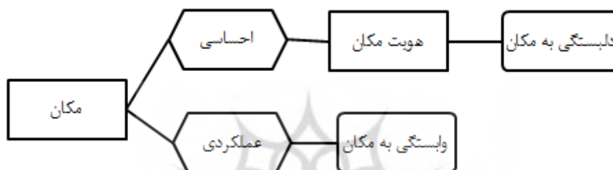
نمودار ۱: دل‌بستگی به مکان و بعد احساسی