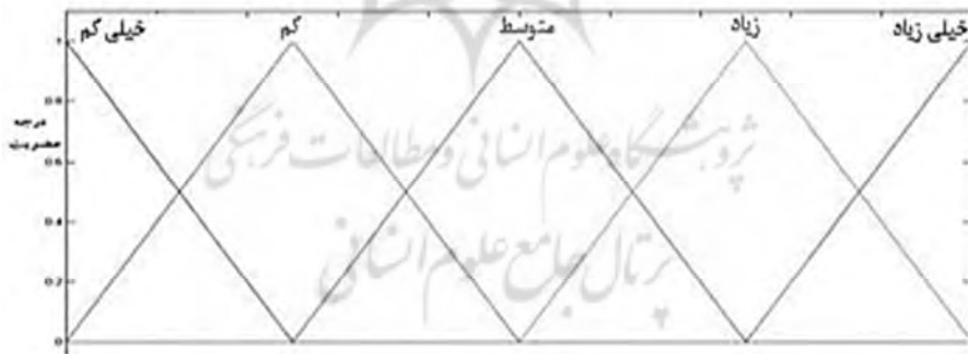
شکل ۲. ارزش‌های زبانی برای متغیرهای زبانی

بعد متغیرهای زبانی را طبق شکل (۲) به اعداد مثلثی تبدیل می نمایم.