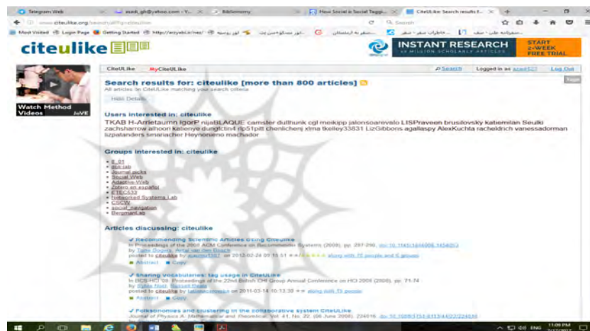
شکل ۲. رابط کاربری پایگاه سایت یولایک پس از انجام جستجو

کتاب‌شناختی مقالات پیوندخورده از حداقل ۳۰ ناشر مختلف و آرشیوهای محتوا (شامل Pubmed) را پشتیبانی می‌کند. کاربران می‌توانند به‌طور دستی، چنین اطلاعاتی را برای سایت‌های پشتیبانی‌نشده ذخیره کنند. این سایت نه تنها امکان مجموعه‌سازی اطلاعات کتاب‌شناختی را فراهم می‌سازد، بلکه به کاربران امکان می‌دهد آنها را برای ایجاد کتابشناسی در قالب بایبکتس و Endnote دانلود کنند. ویژگی منحصر به فرد سایت یولایک این است که به کاربران اجازه می‌دهد نسخه‌های PDF مقالات را در مجموعه برخط پیوندهای خود بارگذاری کنند. این فایل‌ها در سرور سایت یولایک ذخیره می‌شود و به این ترتیب، از هر سامانه متصل به اینترنت قابل دسترسی خواهد بود.