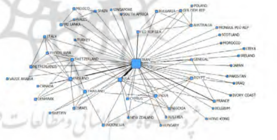
تصویر ۴. شبکه مشارکت بین‌المللی ایران طی سال‌های ۱۹۷۹ تا ۱۹۸۳