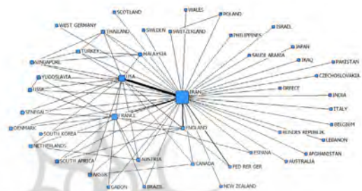
تصویر ۳. شبکه مشارکت بین‌المللی ایران طی سال‌های ۱۹۷۴ تا ۱۹۷۸