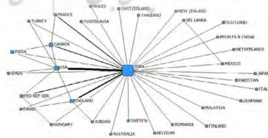
تصویر ۵. شبکه مشارکت بین‌المللی ایران طی سال‌های ۱۹۸۴ تا ۱۹۸۸