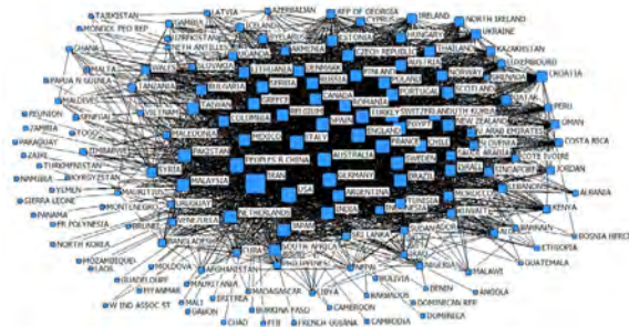
تصویر ۱۰. شبکه مشارکت بین‌المللی ایران طی سال‌های ۲۰۰۹ تا ۲۰۱۳