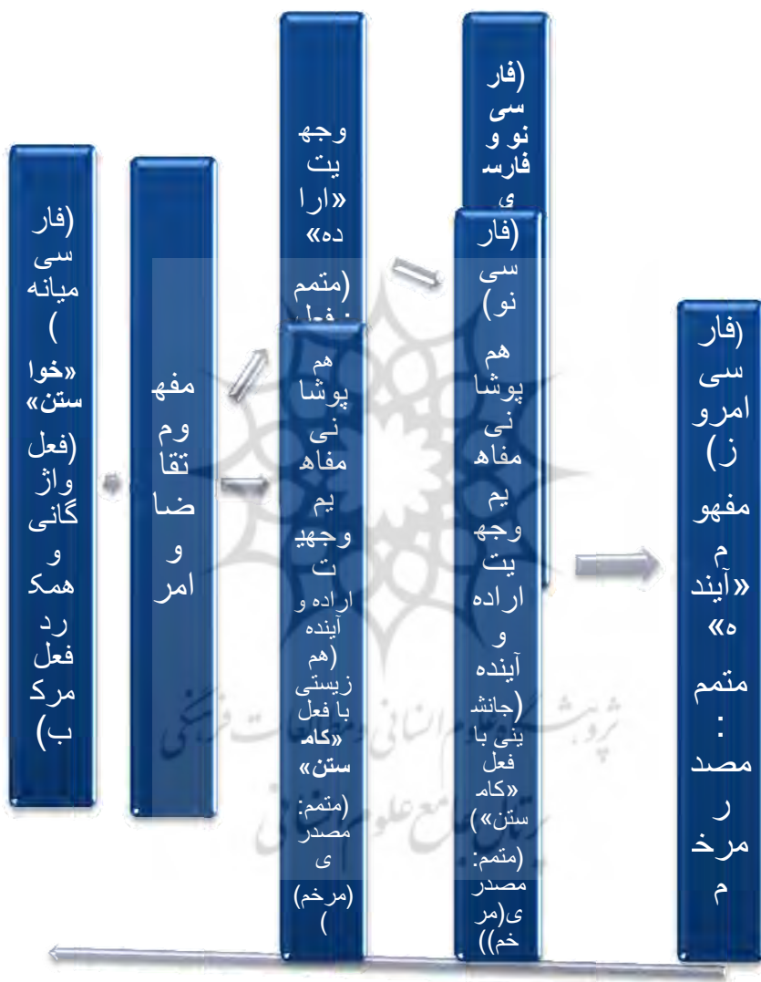
شکل (۱): محور دستوری شدگی فعل «خواستن» از فارسی میانه تا فارسی امروز