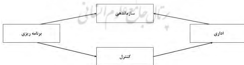
شکل شماره (۱): کارکرد مدیریت روستایی (منبع: فیروز نیا، ۱۳۸۶: ۴۱).

کارکرد مدیریت روستایی را می‌توان در چهار زمینه برنامه‌ریزی، سازمان‌دهی، اداره و کنترل خلاصه نمود که به‌صورت حلقه ابعاد مختلف کارکرد مدیریت روستایی به یکدیگر پیوند داشته و خلل در یکی از زمینه‌ها دیگر عرصه‌ها را نیز دچار مشکل خواهد کرد. هرچند که ممکن است برخی از زمینه‌ها کم‌رنگ باشد؛ اما تمامی عرصه‌های فوق را در حیطه مسائل عمومی روستا شامل می‌شود. بررسی تفصیلی هر یک از ابعاد فوق و ارائه سازوکار لازم برای اجرای ابعاد گسترده وظایف مدیریت روستایی، وظیفه مناسب‌تری را برای تحقق توسعه روستایی فراهم می‌نماید (فیروز نیا، ۱۳۸۶: ۴۱).