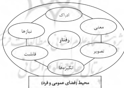
شکل ۱. عوامل تشکیل‌دهنده فرد در محیط