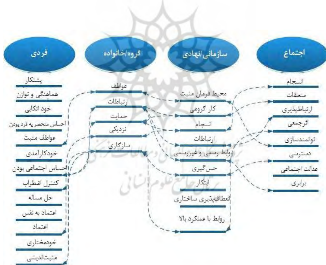
شکل ۱. سطوح و اجزای تاب‌آوری اجتماعی

عوامل پشتیبان در سطح گروه یا خانواده شامل احساسات، ارتباطات، حمایت، نزدیکی و سازگاری هستند، ولی فقط به آن‌ها محدود نمی‌شوند (شکل ۱)؛ بنابراین، توسعه سازوکارهایی برای دستیابی به تاب‌آوری در این سطح، بر تاب‌آوری روانی از نظر انتخاب یک زندگی حیاتی و معتبر و افزایش مقاومت در مقابل استرس و بهبود پس از آن تأثیر می‌گذارد (Bonanno et al., 2006: 182). تاب‌آوری سازمانی و نهادی به‌عنوان عاملی برای غلبه بر مخاطرات روزمره، استرس‌ها و تنش‌ها و بهبود پس از آن‌ها رفتار می‌کند. لینن‌لیوک ۱ تاب‌آوری سازمانی را از طریق ظرفیت آشکارشدن حوادث غیرقابل‌پیش‌بینی و مقاومت در برابر اختلالات خارجی، برای پاسخ با یک روش سریع یا غیرمعمول در برابر چنین حوادثی و جذب تغییرات و بازیابی از تأثیرات آن‌ها تبیین می‌کند. سازوکارها برای دستیابی به تاب‌آوری سازمانی شامل مواردی چون حس‌گیری، جهت‌گیری اشتباه، معماری سازمانی (متمرکز و غیرمتمرکز)، انعطاف‌پذیری ساختاری، هم‌افزایی، روابط عملکردی بالا، رویکردهای ترکیب نهادی (رسمی و غیررسمی) و... می‌شود، ولی محدود به آن‌ها نیست (شکل ۱). تعادل صحیح ویژگی‌های عوامل تعیین‌کننده فوق‌ظرفیت یک سازمان را در واکنش به حوادث پیش‌بینی‌شده و پیش‌بینی‌نشده مختلف تقویت می‌کند (Linnenluecke et al., 2012: 19).