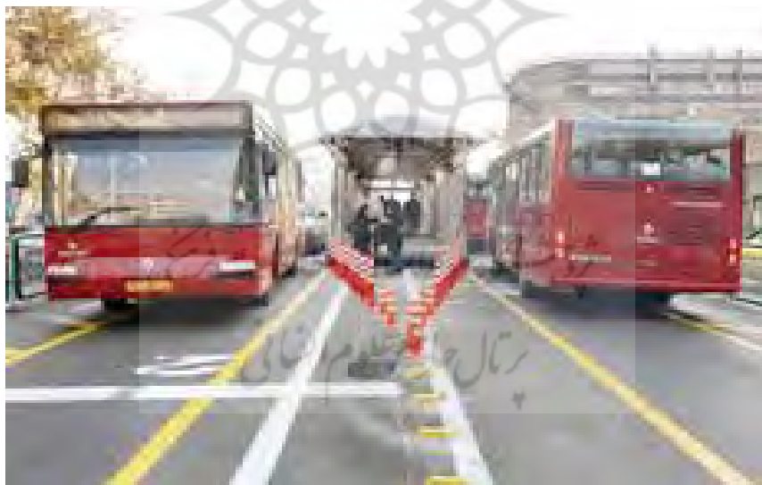
ب- ایستگاه اتوبوس‌های تندرو در کمربندی کلان شهر ارومیه

فرآیند تحلیل سلسله مراتبی (AHP) این معیارها وزن‌دار شدند که در جدول ۲ قابل مشاهده هستند. در جدول ۲ علامت مثبت و منفی برای هر معیار حاکی از آن است که این معیارها دارای ارزش مثبت و منفی هستند و با افزایش معیارهای مثبت، میزان