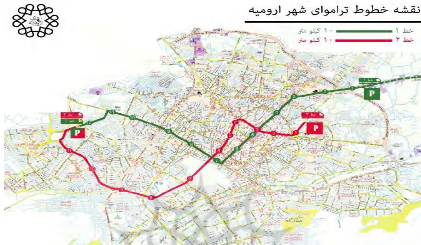
الف- مسیر تراموا کلان شهر ارومیه

کنند و تمرکز در آن‌ها ارائه راه‌حل‌های مطمئن جریان سفر است. به عنوان نمونه سیستم حمل و نقل عمومی کلان شهر ارومیه از مسیر تراموا (TRM) و اتوبوس‌های تندرو (BRT) تشکیل شده که در شکل‌های (الف) و (ب) تصاویر آنها موجود است.