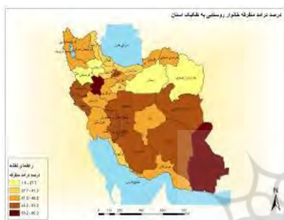
شکل ۵- نقشه درصد درآمد مشاغل متفرقه خانوارهای روستایی به تفکیک استان‌های کشور

ایران از جمله اصفهان، چهارمحال و بختیاری کهگیلویه و بویراحمد و فارس در سطح بالایی است. با توجه به تعریف درآمدهای متفرقه که به کلیه درآمدهایی که از طریق غیر شاغل بودن اعضای خانوار روستایی به دست می‌آید، اطلاق می‌شود، در نواحی مرکزی، جنوب شرقی، غرب و جنوب غربی این شاخص از توزیع بالاتری برخوردار است (شکل ۵).