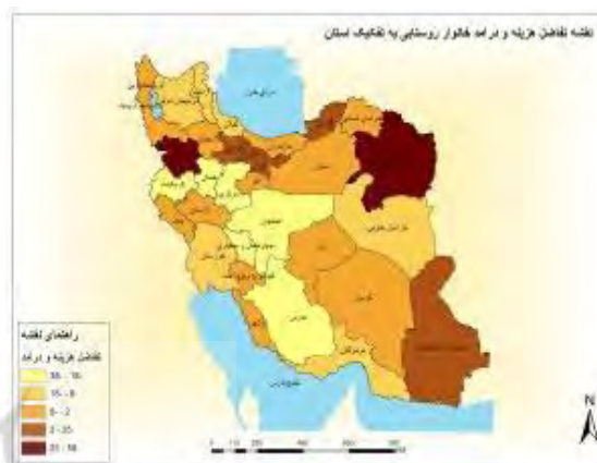
شکل ۸- نقشه تفاوت‌های هزینه و درآمد سالانه خانوارهای روستایی به تفکیک استان‌های کشور

بعد از آن استان‌های تهران، سمنان، البرز، قزوین در طبقات بعدی جای گرفته‌اند (شکل ۸). در واقع، این استان‌های اختلاف بین میزان درآمد و هزینه‌های در سطح خانوار روستایی مثبت بوده و خانوار روستایی توان پس‌انداز و خرید کالاهای غیرخوراکی و سرمایه‌ای را دارند.