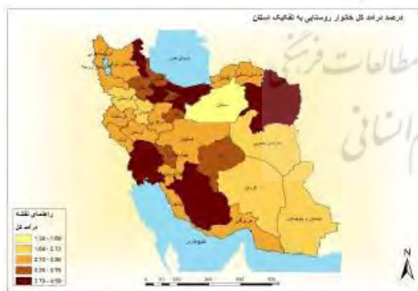
شکل ۱- نقشه درآمد کل خانوار روستایی به تفکیک

نتایج تحقیق برای درآمد کل خانوارهای روستایی در سطح کشور نشان می‌دهد میزان درآمد کلی خانوارها در استان‌های اردبیل، مازندران، قزوین، تهران، خراسان رضوی، خوزستان و فارس در سطح اول است و بعد از آن استان‌هایی چون: چهارمحال، یزد، گیلان، زنجان، قم از وضعیت خوبی برخوردار می‌باشند. عامل اصلی افزایش میزان درآمد در بعضی از این استان‌ها کشاورزی است و در برخی دیگر درآمدهای حاصل از صنایع است؛ به عنوان مثال، عامل اصلی افزایش درآمد روستاییان در استان‌های مازندران، اردبیل، قزوین، فارس و خوزستان با توجه به وسعت اراضی و کشت گونه‌های خاصی گیاهان زراعی؛ چون برنج در مازندران و گیلان، گندم و جو در فارس و قزوین، باغداری و کشت و صنعت دشت مغان در اردبیل بوده است؛ اما عامل افزایش درآمد کلی خانوارهای روستایی در خوزستان وجود کشت و صنعت نیشکر و منابع فسیلی و درآمد حاصل از کار در صنایع و معادن به‌ویژه صنایع پتروشیمی است. در تهران به دلیل این که اکثر روستاها کارکرد خوابگاهی داشته و روستاییان اکثراً در شهر مشغول به کار بوده‌اند، درآمد خوبی داشته‌اند و همچنین شکل‌گیری انواع صنایع کارگاهی در این روستاها سبب بهبود وضعیت درآمدی روستاییان شده است (شکل ۱).