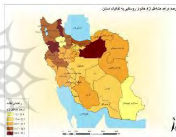
شکل ۴- نقشه درصد درآمد مشاغل آزاد خانوارهای روستایی به تفکیک استان‌های کشور

الگوی کشت مناسب‌تر و در استان اردبیل وجود کشت و صنعت دشت مغان زمینه را برای رونق اقتصادی گروه‌های درآمدی مشاغل آزاد برای خانوارهای روستایی فراهم کرده است. از آنجا که مشاغل آزاد بیشتر خانوارهای روستایی شامل فعالیت‌های کشاورزی است، در استان‌های مذکور نسبت کشاورزی به کل کشور در سطح بالایی بوده و سبب افزایش درآمد روستاییان در این نواحی شده است. به طور کلی، منطقه شمال و غرب کشور به‌ویژه از شرق استان گلستان تا غربی‌ترین نقطه کشور و به سمت جنوب غربی تا استان‌های کرمانشاه و لرستان درآمد حاصل خانوارهای روستایی از راه زراعت است (شکل ۴).