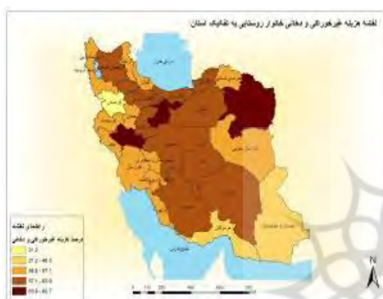
شکل ۷- نقشه درصد هزینه‌های غیرخوراکی و دخانی خانوارهای روستایی به تفکیک استان‌های کشور

خانوارهای روستایی موضوع قرار گرفتن در مجاورت کلان‌شهری چون تهران سبب تأثیر آن بر درآمد روستاییان شده است. همچنین، در استان‌های قم و مشهد عامل اصلی نقش گردش‌گری مذهبی است که سبب رونق اقتصادی و در نتیجه افزایش درآمد خانوارهای روستایی شده است. خط مرکزی که از شمال غرب کشور شروع شده و به سمت جنوب شرق در حرکت است، نشان می‌دهد میزان هزینه غیرخوراکی بالا بوده و بیشتر درآمد صرف خرید کالای سرمایه‌ای می‌شود.