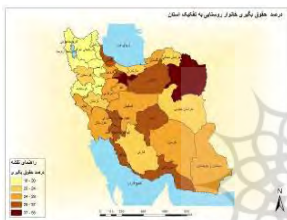
شکل ۳- نقشه درصد درآمد حقوق‌بگیری خانوارهای

در شب‌ها به روستاها برای اسکان و استراحت شده است. همچنین، علت درصد زیاد درآمد حقوق‌بگیری خانوارهای روستایی در استان خراسان رضوی به بحث گردش‌گری مذهبی مرتبط می‌شود؛ به طوری که این استان با جذب گردش‌گر زیاد و شکل‌گیری مشاغل خدماتی در روستاها موجب انتقال جمعیت شاغل در بخش کشاورزی به بخش خدمات شده است و با توجه به وضعیت کشاورزی، (زعفران- کاری) و کاربرد این محصول نقش مهمی در افزایش شاخص حقوق‌بگیری داشته است.