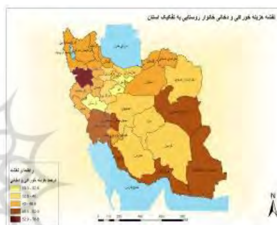
شکل ۶- نقشه درصد هزینه خوراکی و دخانی خانوارهای روستایی به تفکیک استان‌های کشور

هزینه‌های خوراکی می‌کند. در استان‌های حاشیه خلیج فارس (خوزستان، بوشهر، هرمزگان، سیستان، خراسان جنوبی) میزان هزینه خوراکی و دخانی به شدت بالا بوده که ناشی از فقر و نابرابری در توزیع درآمدهاست (شکل ۶). نوار حاشیه مرزی کشور به شدت دچار فقر بوده و اکثر درآمد صرف هزینه‌های خوراکی و دخانی می‌شود. این الگو نشان می‌دهد که خانوارهای روستایی در استان‌های حاشیه‌ای کشور در وضعیت رو به بحران بوده و در برنامه‌ریزی‌ها به‌ویژه در برنامه ششم کشور باید به صورت جدی بررسی شود.