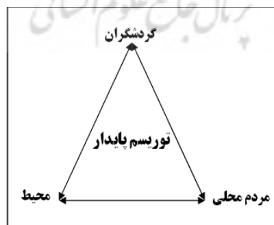
شکل (۱). مثلث گردشگری پایدار (افتخاری و همکاران، ۱۳۸۹: ۵)