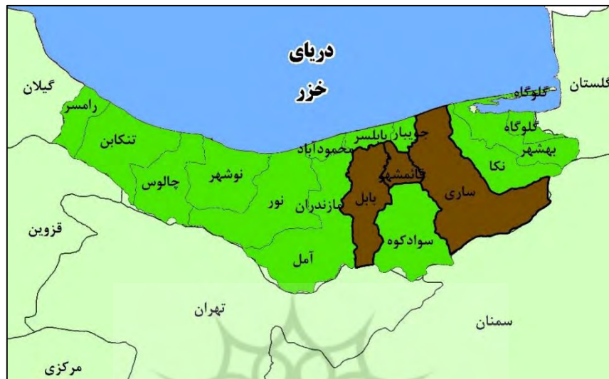
شکل (۱). موقعیت محدوده مورد مطالعه