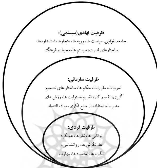
شکل ۱. سطوح و درهم‌تنیدگی ظرفیت و توسعه