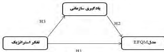
شکل شماره (۱): مدل مفهومی پژوهش

با استفاده از مرور ادبیات و پیشینه پژوهش های موجود در رابطه با موضوع این پژوهش و مطالعه چندین مدل ارائه شده توسط محققین گذشته مدل مفهومی و به صورت فرضی استقرایی بر اساس مدل لیدکا به صورت زیر طراحی شده است.