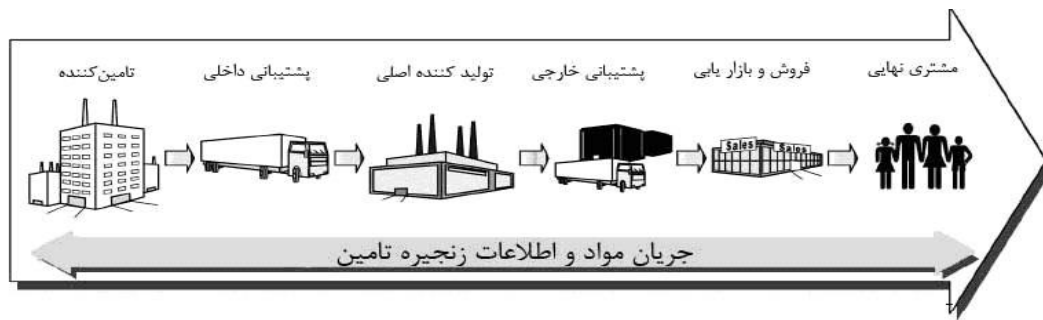
شکل شماره (۱): مدل مفهومی زنجیره تأمین (Asgharizadeh &amp; Ghasemi, 2011)

طراحی و مدیریت زنجیره تأمین، به تولید و تحویل محصولات گوناگون با هزینه پایین، کیفیت بالا و زمان کوتاه تحویل کمک می‌کند. رقابت جهانی فشار زیادی را بر محصول و عرضه دهندگان خدمات تحمیل کرده است تا عملیات و شیوه‌های آن را بهبود دهند. با این حال، موفقیت زنجیره تأمین به چگونگی طراحی و اجرای آن، شناسایی ترکیبی مؤثر از تأمین‌کنندگان، تولیدکنندگان، توزیع‌کنندگان و نظارت بر عملکرد زنجیره تأمین بستگی زیادی دارد (Burgess & et al, 2006). مدیریت زنجیره تأمین از جمله مفاهیم استعاره‌ای در عرصه مدیریت است و از این رو از دیدگاه‌های مختلف مورد توجه قرار گرفته است. از آن جمله می‌توان به تحلیل فراروش ۲ در این زمینه اشاره کرد (جدول ۱). شرکت‌ها می‌توانند از طریق فناوری اطلاعات به طور خودکار جریان محصول و اطلاعات مربوط به ظرفیت تولید، تقاضای مشتری، موجودی در هزینه پایین‌تر را مدیریت کنند. اطلاعات به اشتراک گذاشته شده عملکرد زنجیره تأمین را بهبود می‌بخشد. یکی از چالش‌های مهم شرکت‌های بزرگ چگونگی به‌کارگیری فناوری اطلاعات برای افزایش بهره‌وری زنجیره تأمین است (Russell & Anne, 2007).