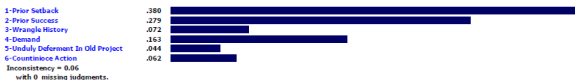
شکل شماره (۱۴): امتیازات زیرمعیارهای معیار حسن سابقه محاسبه شده توسط نرم افزار (تصویر از خروجی نرم افزار)

Priorities with respect to: Goal: Evaluation Contractor EPC >Fame