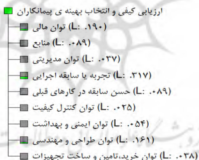
شکل شماره (۱۰) - ساختار درختی وزن معیارها (تصویر از خروجی نرم افزار)

پس از تعیین وزن معیارها، پاسخ نامه ی خبرگان در خصوص زیرمعیارها به مانند آنچه در خصوص معیارها گفته شد، جدول میانگین زیرمعیارهای هر یک از معیارها تهیه می گردد، در شکل ۱۰ و ۱۱ به عنوان نمونه پاسخنامه ی یکی از خبرگان در خصوص زیر معیارهای، معیار حسن سابقه و همچنین جدول محاسبه میانگین امتیازات این زیرمعیارها آورده شده است.