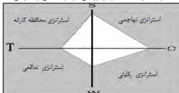
شکل شماره (۳): نمودار ارزیابی عوامل داخلی و خارجی