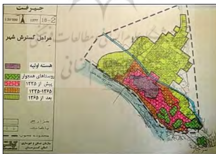
شکل ۲- روند توسعه فیزیکی شهر جیرفت در ارتباط با رودخانه‌های سه‌گانه

رودخانه‌ها؛ رودخانه‌های ۳ گانه سبب خسارات جانی و مالی در محدوده شهر می‌شود. بحران‌های ناشی از سیلاب، بزرگترین دغدغه ستاد مدیریت بحران شهرستان است. گذر سه رودخانه هلیل، ملنتی و شور از درون و حاشیه شهر جیرفت بین کاربری-های شهر فاصله انداخته است. بعضی بخش‌های شهر جیرفت بیشتر تحت تأثیر آسیب-های این سه رودخانه هستند و گذر این رودخانه‌ها از محلات شهر، هر ساله خسارات مالی و جانی در بعضی محلات شهر جیرفت بر جای می‌گذارد. محلاتی که امروزه در خطر رودخانه هلیل قرار دارند کهوریه، کلرود، رهجرد و بهجرد هستند و محلات آسیب‌پذیر از رود ملنتی نیز شهرک فجر، حاشیه بلوار خلیج فارس و حسین‌آباد است. رودخانه شور نیز خساراتی را به محله سرجاز و روستای جنگل‌آباد وارد می‌سازد. بر اساس آمار حاصل از اداره کل منابع طبیعی، بیشترین جریان آب سال‌های اخیر در محلات حاشیه ملنتی و سپس هلیل بوده که سبب خسارات جانی و آسیب به ساختمان‌ها و مراکز اطراف خود شده‌است؛ به طوری که محله حسین‌آباد که تحت تأثیر رودخانه ملنتی است در سال ۹۲ به دلیل خروج آب از بستر روخانه و طغیان آب در محله سبب آسیب‌رسانی به هزار واحد مسکونی (۲۰-۵۰ درصد) شد.