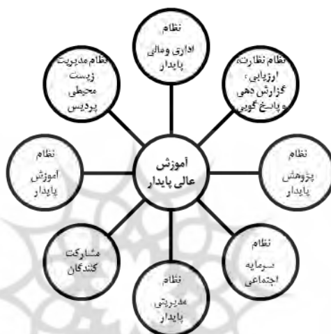
شکل شماره ۳. ابعاد آموزش عالی پایدار

روایی چارچوب ارائه شده (شکل ۳)، از طریق روایی محتوا حاصل شده، که این امر از دو جنبه صورت گرفته است. جنبه اول، استفاده از اجزاء و عوامل ارائه شده در تحقیق‌های پیشین است که خود به روایی چارچوب منجر گردید و جنبه دوم، تشکیل جلسه گروه کانونی با خبرگان دانشگاهی که در زمینه توسعه