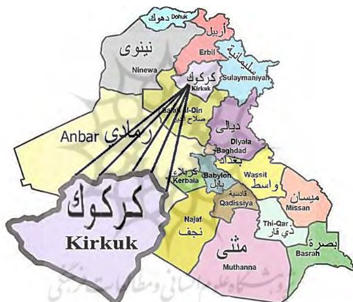
نقشهٔ ۱. تقسیمات کشوری عراق با تأکید بر استان کرکوک

محور این نوشتار بر کشمکش‌های سرزمینی در شمال عراق به‌ویژه «استان نفت‌خیز کرکوک» متمرکز است که مورد مناقشهٔ گروه‌های قومی تشکیل‌دهندهٔ آن یعنی کردها، ترکمن‌ها و عرب‌ها با حکومت مرکزی است (نقشهٔ ۱). امروزه، برابر «قانون اساسی عراق» نظام حکومتی این کشور جمهوری، فدرال، دموکراتیک و تک‌گراست و قدرت در آن بین «حکومت فدرال» و «حکومت‌های محلی» (مرکزی، شمالی، جنوبی)، «استان‌ها»، «شهرها» و «ادارات محلی» تقسیم شده است.