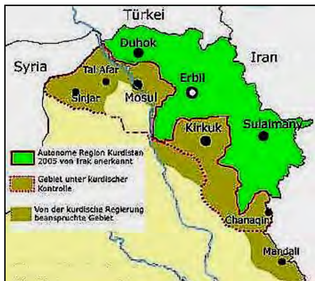
نقشه ۳. محدوده اقلیم کردستان و مناطق مورد کشمکش با دولت مرکزی عراق