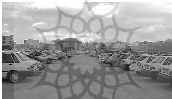
تصویر ۳. تخریب‌های کالبدی ضلع شمالی سبزه‌میدان

علی‌رغم تنوعی که در مکان‌های سوم بررسی شد، مشاهده می‌شود که در محدوده سبزه‌میدان، تغییر چندانی حاصل نشده و تنها برخی از مکان‌ها حذف شده‌اند. بدین ترتیب، در عمل فضاهای تعریف‌شده در این محدوده در سه دوره بررسی شده یکسان‌اند و درحال حاضر، بارزترین مکان‌های سوم، محدوده سبزه‌میدان، مسجد جامع و خود فضای اصلی سبزه‌میدان هستند. به‌جز این دو مکان، تقریباً همه مکان‌های سومی که در این محدوده وجود داشتند، از بین رفته‌اند. از سوی دیگر، مرکزیت اجتماعی سبزه‌میدان نیز به‌شدت رو به افول است و طرح‌های شهری و تخریب‌های کالبدی ناشی از این طرح‌ها، وضعیت این محدوده را بدتر از پیش می‌کند. با توجه به تمامی مباحث مطرح‌شده، به‌نظر می‌رسد پتانسیل غیرقابل‌انکار مکان‌های سوم در راستای تعدیل جدایی‌گزینی‌های اجتماعی، اختلاط طبقات اجتماعی، رفع تبعیض جنسیتی و مهم‌تر از همه، ارتقای حیات مدنی و گسترش حوزه عمومی را می‌توان عامل محکمی برای حرکت مسئولان به‌سمت احیا و بازآفرینی این مکان‌ها، کنترل آسیب‌های اجتماعی آن‌ها در راستای افزایش کنش‌های مثبت اجتماعی شهروندان، گسترش فضاهای گفت‌وگو و تبادل نظر و در نتیجه، توسعه حوزه عمومی به‌شمار آورد.