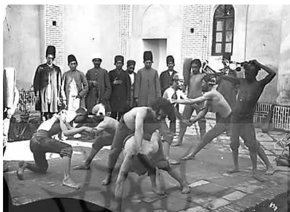
تصویر ۱. نمایی از یک زورخانه (یکی از مکان‌های سوم با ماهیت مذهبی)

مسجد جامع نیز اهمیت فراوانی داشت. حیاط مسجد یکی از مکان‌های جمع‌شدن عمومی پرمخاطب شهر بود که با داشتن فضایی دینی، محبوبیت زیادی در میان شهروندان پیدا کرده بود. از ساعتی پیش از اذان ظهر و عصر تا ساعتی پس از آن، مردم به مسجد مراجعه و درباره مسائل روز گفت‌وگو می‌کردند. حضور رهبران دینی و بزرگان شهر نیز این جمع‌ها را پررونق‌تر می‌کرد. در ساعات دیگر روز نیز افراد به‌صورت پیوسته به حیاط مسجد مراجعه می‌کردند و ساعات فراغت خود را در آنجا می‌گذراندند.