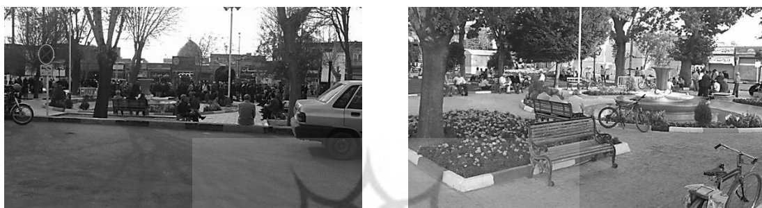
تصویر ۲. زندگی اجتماعی عمومی پویا و غنی در سبزه‌میدان

از سوی دیگر، بازار از زمان احداث تا امروز جزء عناصر اصلی ساختار شهر بوده است و یکی از باثبات‌ترین عناصر کالبدی شهر محسوب می‌شود که علی‌رغم به‌وجود آمدن تغییراتی در ماهیت تجاری آن، همچنان تأثیر غیرقابل‌انکاری بر ساختار اقتصادی و اجتماعی محیط اطراف خود دارد. مهم‌ترین فضایی که در ارتباط با بازار تعریف شده، سبزه‌میدان است که از گذشته تاکنون، همواره نقش یک مکان سوم کارآمد را ایفا می‌کند و مانند مسجد، فرم و عملکرد خود را تقریباً حفظ کرده است. سبزه‌میدان عرصه‌ای پویاست که با وجود تغییراتی اساسی در محیط اطراف آن، همچنان به‌عنوان یک مکان جمع‌شدن عمومی کارا عمل می‌کند. این تغییرات عبارت‌اند از: حذف عملکردهای مؤثری که در گذشته در اطراف آن وجود داشته است، تغییرات کالبدی عظیم و تخریب‌های گسترده در بدنه‌های اطراف، تغییر گروه‌های اجتماعی استفاده‌کننده غالب و جایگزینی بازنشستگان و سالمندان به‌جای خانواده‌ها.