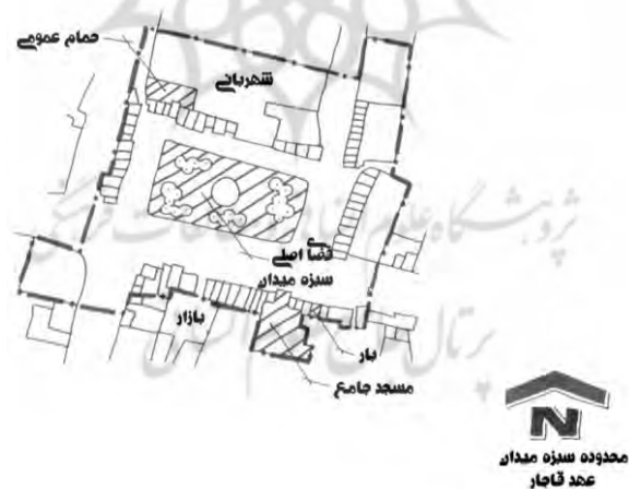
نقشه ۱. مکان‌های سوم سبزه‌میدان، عهد قجر

حمام عمومی، مکانی با کارکرد مشخص بود که عملکرد اجتماعی خود را به‌مرور زمان و در کنار عملکرد اصلی به‌دست آورد. این حمام که محیطی زنانه بود، به محلی برای گفت‌وگوی خانم‌ها و تبادل افکار آن‌ها تبدیل شده بود. البته این مکان، تنها مکانی نیست که تفکیک جنسیتی در آن مشاهده می‌شد و میخانه‌ها هم به مردان اختصاص داشتند. در میخانه‌ها نیز بستر شکل‌گیری مکالمه میان مراجعان وجود داشت و جریان زندگی اجتماعی قوی بود. نکته حائز اهمیت آن است که در محدوده سبزه‌میدان، زندگی شبانه وجود نداشت. همه واحدهای تجاری و حتی مساجد در طی شب بسته می‌شدند و کمتر کسی در ساعات پایانی شب در خیابان رفت‌وآمد می‌کرد.