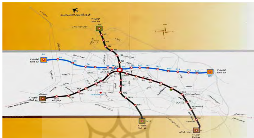
شکل (۲) خطوط قطار شهر تبریز