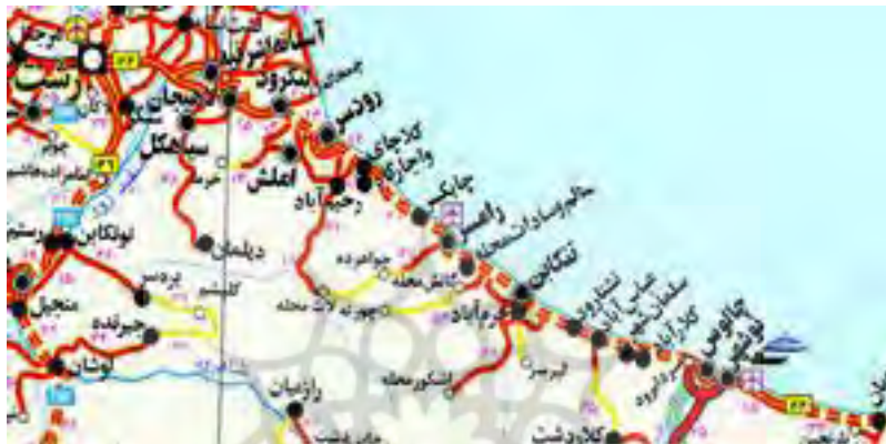
شکل ۲: نقشه موقعیت شهر چابکسر در نقشه استان گیلان

جمعیت شهر چابکسر بر اساس سرشماری نفوس و مسکن ۱۳۹۰ تعداد ۶۹۹۴ نفر می‌باشد و نرخ رشد طبیعی جمعیت آن ۱/۲۳- می‌باشد. نسبت جنسی ۹۸/۰۷ و توزیع سنی شهر چابکسر در گروه سنی ۱۵- ۶۴ سال قابل توجه است و توزیع نسبی آن معادل ۷۳/۸۶ درصد جمعیت را شامل می‌شود. عدم سرمایه‌گذاری لازم برای ایجاد فرصت‌های جدید شغلی و مجموعه‌ای از این دست عوامل سبب مهاجر فرست شدن این شهر شده است (استاندارداری گیلان، ۱۳۹۰: ۱۸).